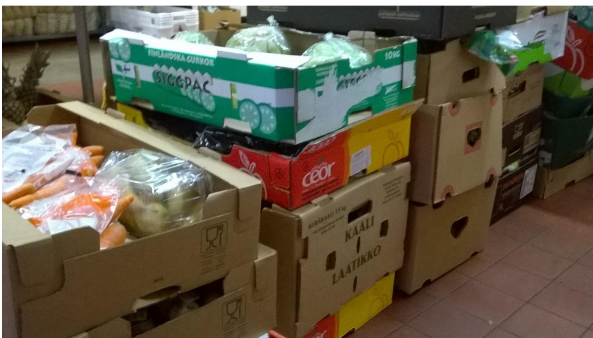
Kuva 3. Laatikoita odottamassa lajittelua.

Yksikössä on selkeä työnjako naisten ja miesten välillä: aamupäivän aikana miehet hakevat kuormia kaupoilta ja tuovat ne toimipisteeseen, jossa naiset hoitavat lajittelun ja esillepanon. Iltapäivällä alkaa puolitoista tuntia kestävä ruoan jako, johon osallistuvat sekä miehet että naiset. Ruoan jakoa edeltää rukous, joka pidetään vapaaehtoisten kesken ennen ovien avaamista asiakkaille. Salosen (2016) mukaan uskonnollisuus jakaa ruoka-apua jakavia toimijoita: toisinaan sitä pidetään merkittävänä osana toimintaa, toisinaan taas mahdollisena ongelmana. Tässä yksikössä uskonnollisuutta ei tuoda voimakkaasti esiin asiakkaille, eli uskonnollisuus on vain arvo toiminnan taustalla, eikä hengellinen toiminta ole osa tarjottua palvelua. Yhdistyksen uskonnollinen arvomaailma ei näy asiakkaille muutoin kuin uskonnollisina kuvina seinillä.