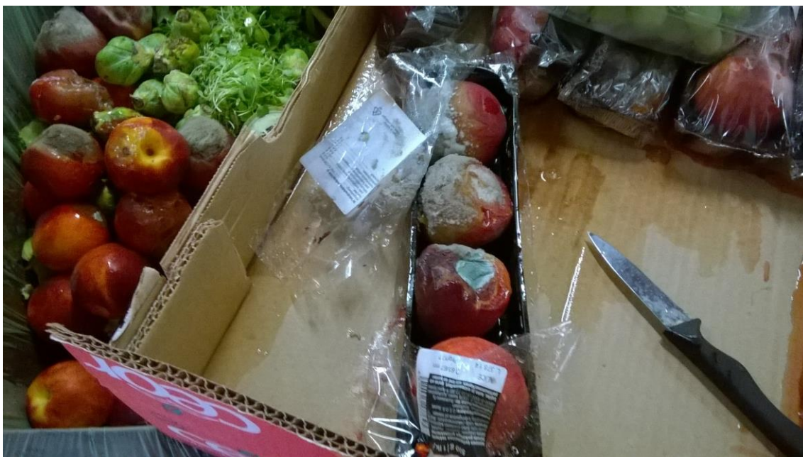
Kuva 2. Nektariinien läpikäyntiä.

Muut tuotteet: tuotteesta ja päiväyksestä riippuen joko jakoon, eläinten ruoaksi tai biojätteeseen.” (Kenttämuistiinpanot, kesä 2016.)