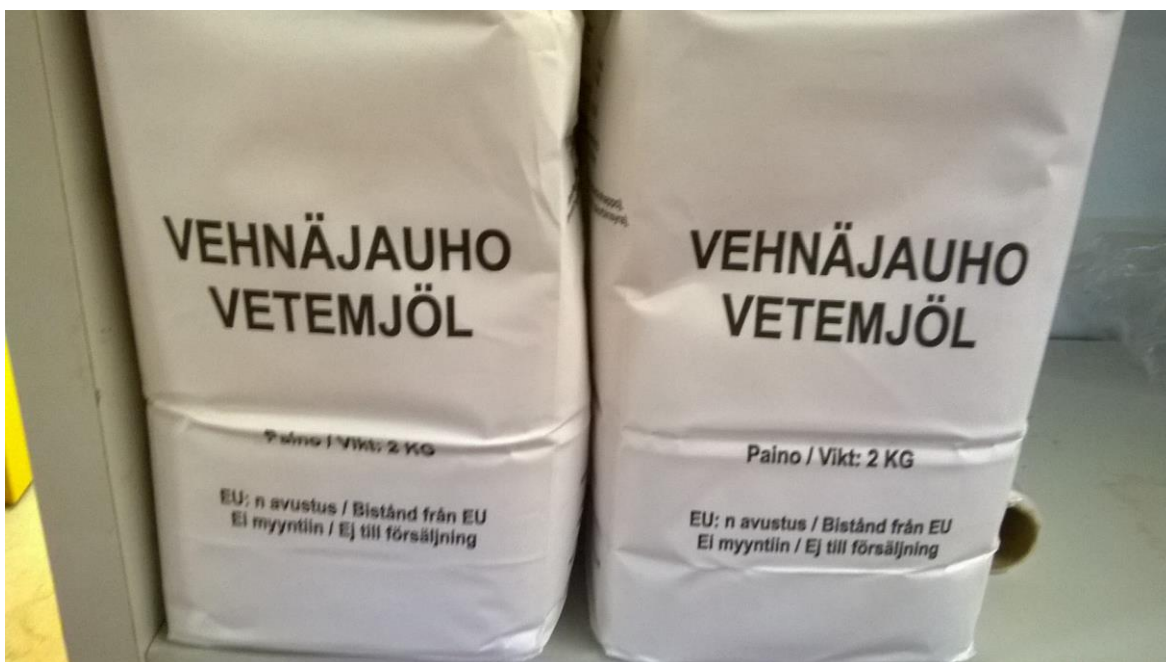
Kuva 1. EU:n avustusjauhoja.

Yksikkö jakaa sekä kauppojen ylijäämäruokaa että EU:n avustusruokaa. Maksutonta EU-avustusta jaetaan kuukaudessa noin sadalle henkilölle. Jotta toiminnan kulut saadaan katettua, ylijäämäruoan hakijoilta kerätään 4€ maksu, joka oikeuttaa kahteen kassilliseen ruokaa. Kuukaudessa toimipisteessä asioi melkein 500 maksavaa asiakasta, lisäksi noin 160, joilta maksua ei peritä. ”Kulkijoita”, eli tilapäisiä asiakkaita, joita ei rekisteröidä, on kuukaudessa noin 65.