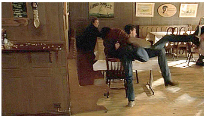
Kuvat 6 ja 7 (kuva- kaappaus DVD:ltä). Wallander: Valoku- vaaja . Ravintolassa ja sairaalassa.