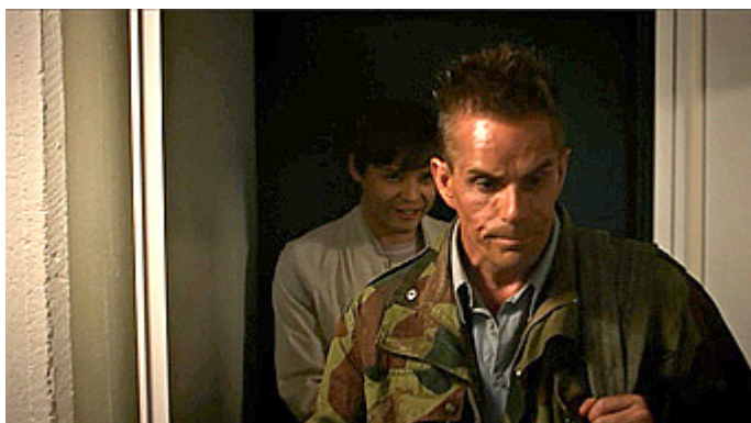
Kuva 21 (kuvakaappaus DVD:ltä). Vares – Huhtikuun tytöt . Tristan etualalla.