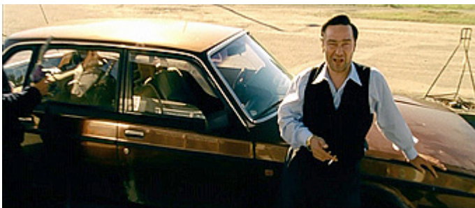
Kuvat 1–2 (kuvakaappaukset DVD:ltä). V2 – Jäätynyt enkeli . Huoltoaseman pihalla.

rinkäsitysten varaan (esim. Herkman 2001, 369–370; Bergson 1994, 76–83). Väkivallan uhrin käyttäytyminen kohtauksen alussa rehvakkaan itsevarmoina tulta savukkeeseen ystävällisesti pyytävää Hopeaa kohtaan (kuva 1). Yhtäkkiä Hopea iskee nyrkillä toista miestä, joka lentää autoa päin. Uhrin status romahtaa (kuva 2). Tämän jälkeen Hopea pahoinpitelee myös toisen miestä. Väkivallan aikana kohtauksessa käytetään tehokeinona rock-musiikkia, joka vahvistaa väkivallan intensiteettiä. Komiikkaa rakennetaan kohtauksessa myös yhteensopimattomuuden varaan yhdistämällä yllättäviä asioita sekä dialogissa että visuaalisessa kerronnassa (ks. esim. Herkman 2001, 370). Näin tehdään esimerkiksi kohtauksen lopussa, jossa uhrin istuvat autossa verisinä ja puolittajuttomina. Hopea laskee ikkunasta auton täyteen bensaa ja puhuu rauhallisen ystävällisesti: ”Eipä sitten muuta kuin turvallista matkaa. Katos, katos olihan mulla täällä sytkäri.” Hopea kaivaa sytyttimen taskustaan (kuva 3). Uhrin tajuavat yhtäkkiä auton olevan täynnä bensaa ja ajavat kauhuissaan pois. Komiikkaa rakennetaan sen ristiriidan kautta, että väkivaltaisesti toimiva Hopea puhuu ystävällisen leikkisästi. Bensaa täynnä oleva auto ja yllättäen esiin kaivettu sytytin luovat vaarallisen elementin, ja komiikka syntyy yllätyksellisestä käänteestä (sytytin) ja ristiriidasta (ystävällisen rauhallinen toiminta ja vaarallinen tilanne).