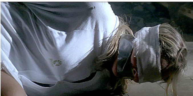
Kuvat 9 ja 10 (kuvakaappaukset DVD:ltä). Wallander: Mastermind . Linda ja Theresa väkivallan uhreina.