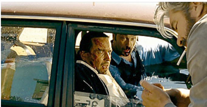
Kuva 3 (kuvakaappaus DVD:ltä). V2 – Jäätynyt enkeli . Bensa ja sytytin luovat vaarallisen elementin.