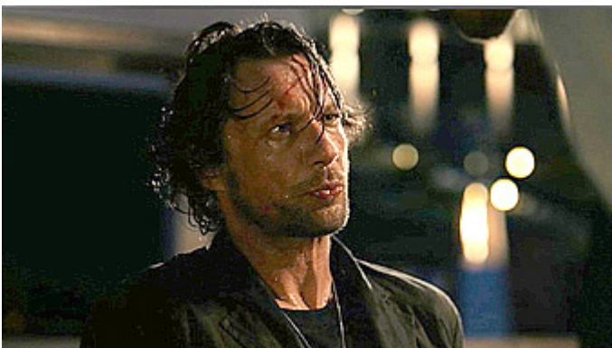
Kuva 8 (kuvakaappaus DVD:ltä). Vares – Huhtikuun tytöt . Vares ottaa iskuja vastaan.