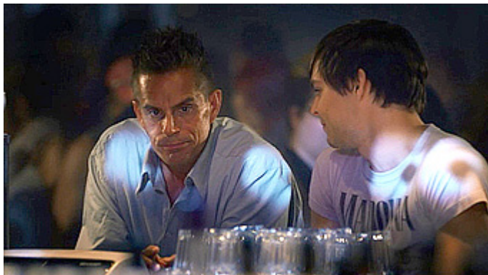
Kuva 18 (kuvakaappaus DVD:ltä). Vares – Huhtikuun tytöt . Ravintolassa.

kauttaaltaan veressä oleva kylpyhuone ja Tristan kirves kädessä (kuva 22) sekä myöhempi kohtaus, jossa Tristan kantaa Maxin paloja muovikasseissa, riittävät antamaan katsojalle mielikuvan siitä, mitä Maxille on tehty. Väkivallanteko näyttäytyy niin julmana, että katsoja joutuu moraalisesti pohtimaan omaa