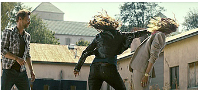
Kuva 11 (kuvakaappaus DVD:ltä). Vares – Sheriffi . Naiset ja miesten väkivalta.