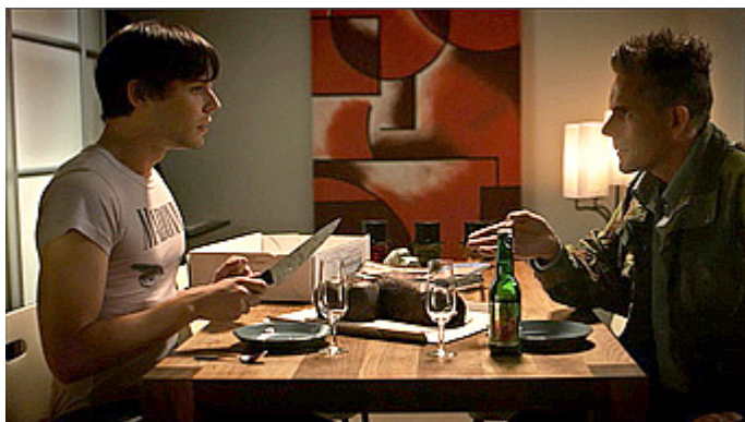
Kuva 19 (kuvakaappaus DVD:ltä). Vares – Huhtikuun tytöt . Max hämmmentyy.