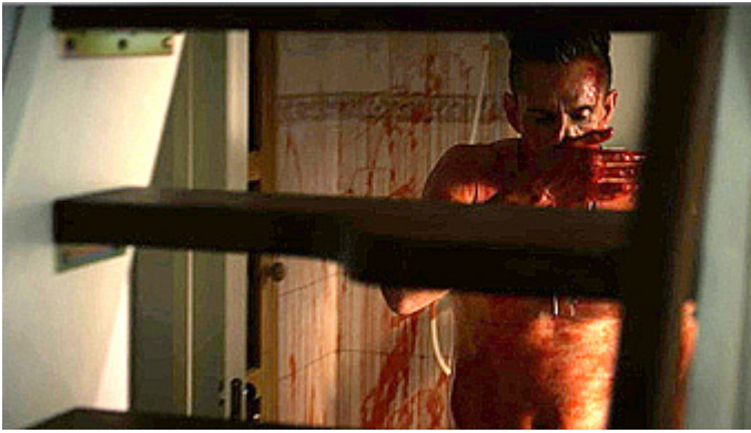
Kuva 22 (kuvakaappaus DVD:ltä). Vares – Huhtikuun tytöt . Vä-kivallanteko.

14 Kuten Judith Halberstam (2001, 253) esittää, homofobian väkivaltaisten vaikutusten esityksiä ei tule samastaa homofobiaan itseensä.