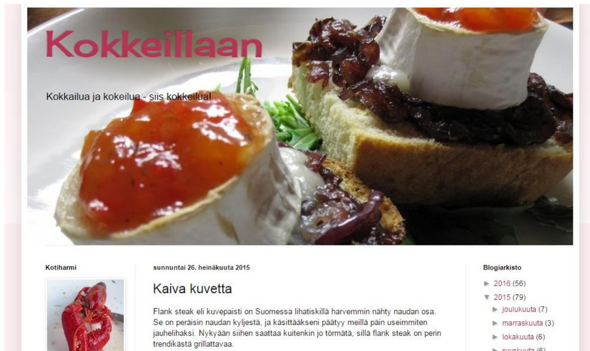
Kuvio 1. Esimerkki ruokablogin yläbannerista (kuvakaappaus K 2015a).

Ruokablogien julkaisuaktiivisuus voi vaikuttaa siihen, millaisiksi kirjoitukset muotoutuvat. Aktiivisimmat bloggaajat tuottavat sisältöä päivittäin tai lähes päivittäin, ja koko ruokablogissa voi olla tuhansia kirjoituksia. Heille on saattanut muodostua ominainen skeema, jonka mukaan he tyypillisesti rakentavat ruokablogikirjoituksensa. Toiset taas julkaisevat harvemmin, ja kirjoitukset saattavat olla muita huomattavasti laajempia, kun yhdellä kertaa on enemmän kerrottavaa. Taulukko 4 esittää ruokablogien julkaisuaktiivisuutta. Olen poiminut siihen myös blogien ensimmäisten kirjoitusten julkaisupäivämäärät, joita voidaan pitää blogien perustamispäivinä. Aloitussajat osoittavat, että moni harrastajabloggaaja on ylläpitänyt blogiaan useitten vuosien ajan.