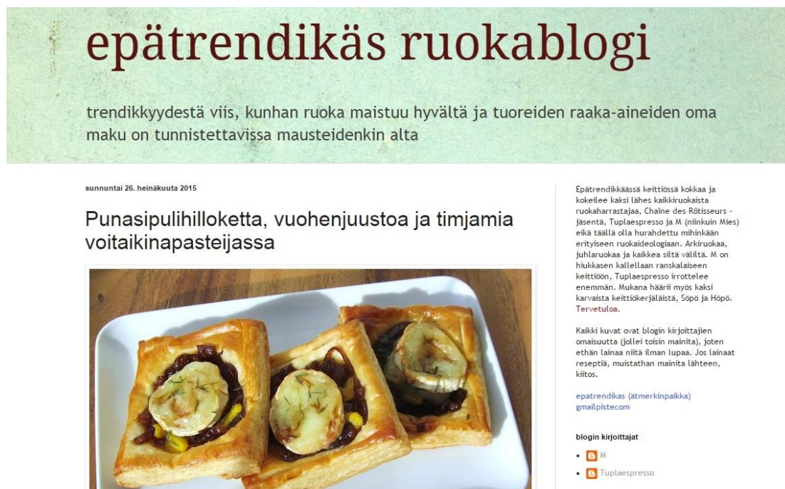
Kuvio 2. Esimerkki ruokablogin ja sen kirjoittajien esittelystä (kuvakaappaus ER 2015a).

laisiin ruokiin blogissa keskitytään. Seuraavassa kuvassa 2 näkyy esimerkki epätrendikkään ruokablogin ja sen kirjoittajien esittelystä, joka sijaitsee blogin oikeassa reunassa. Kuva 3 puolestaan esittää, kuinka blogin toinen kirjoittaja, nimimerkki M , esittäytyy Bloggerin käyttäjäprofiilisivulla.