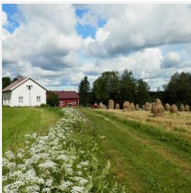
Suomen Asutusmuseon pihapiiri sijaitsee kauniilla paikalla järven rannalla.

Museokävijän silmissä 1950-luvun alussa rakennettu rintamamiestalo pihapiireineen näyttää nostalgiselta. Evakkosisarusten koti herättää kävijässä muitakin tuntemuksia, koska Mureen perheen tarina kietoutuu osaksi siirtoväen vaiheita evakkopoluilla ja jälleenrakennustöissä.