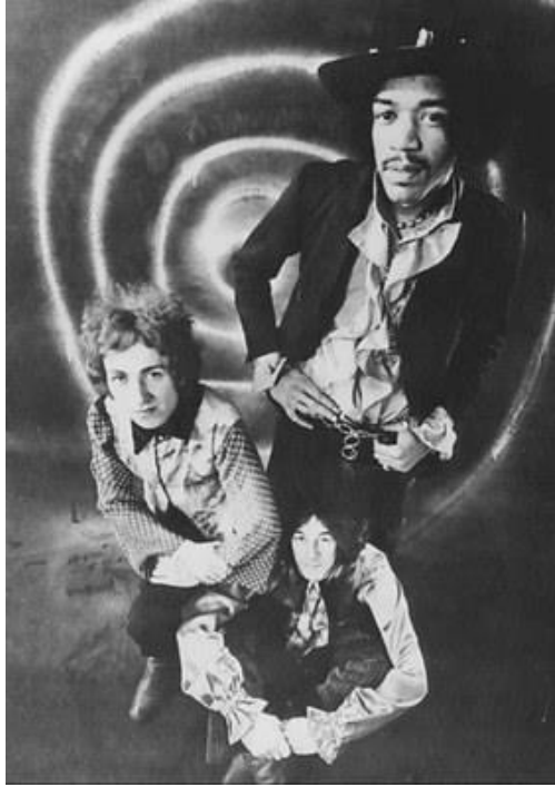
The Jimi Hendrix Experience vuonna 1968.

Tänä päivänä Suosikki-lehden kuvaukset lähinnä hymyilyttävät, sillä on selvää, että noin ei enää kirjoitettaisi. Muun muassa Stuart Hallilla on ollut suuri vaikutus siihen, miten suhtaudumme mustiin, ja ylipäätään toisiin.