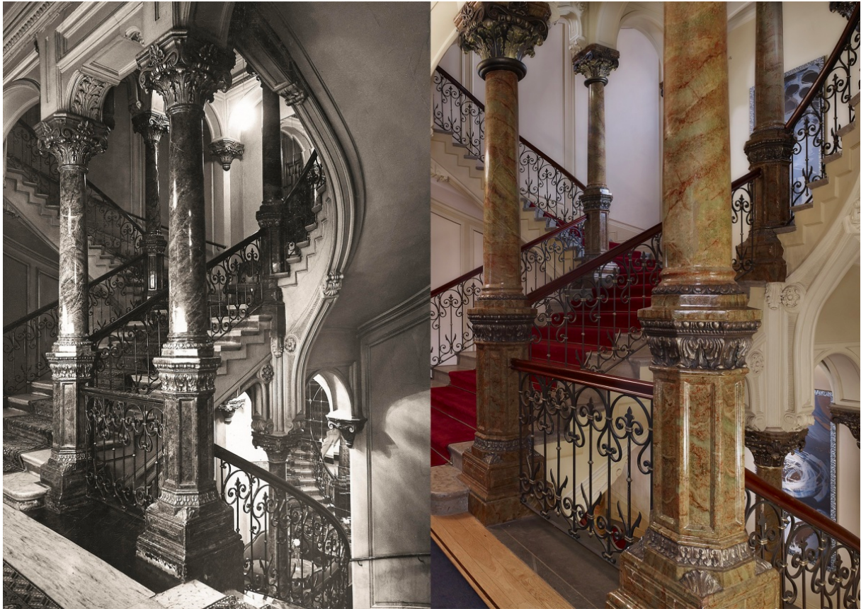
Kuva 2. Hotelli Kämpin pääportaikko 287

Toinen sijainnin määrittelyn ongelmaan liittyvä esimerkki on Presidentinlinnan goottilaisen salin vuonna 1970 valmistunut korjaus, jolloin salin katto rekonstruoidiin 1840-luvun asuun. Työ perustui C.A. Engelin alkuperäisiin piirustuksiin. 288 Sali oli uudelleen arvioinnin kohteena 2010-luvun alussa. Tuolloin päädyttiin väritutkimuksien perusteella palauttamaan salin katto 1800-luvun lopun asuun. Tutkijoiden mukaan väritutkimusten tulokset osoittivat, että katto ei 1800-luvulla koskaan ole ollut edellä mainittujen