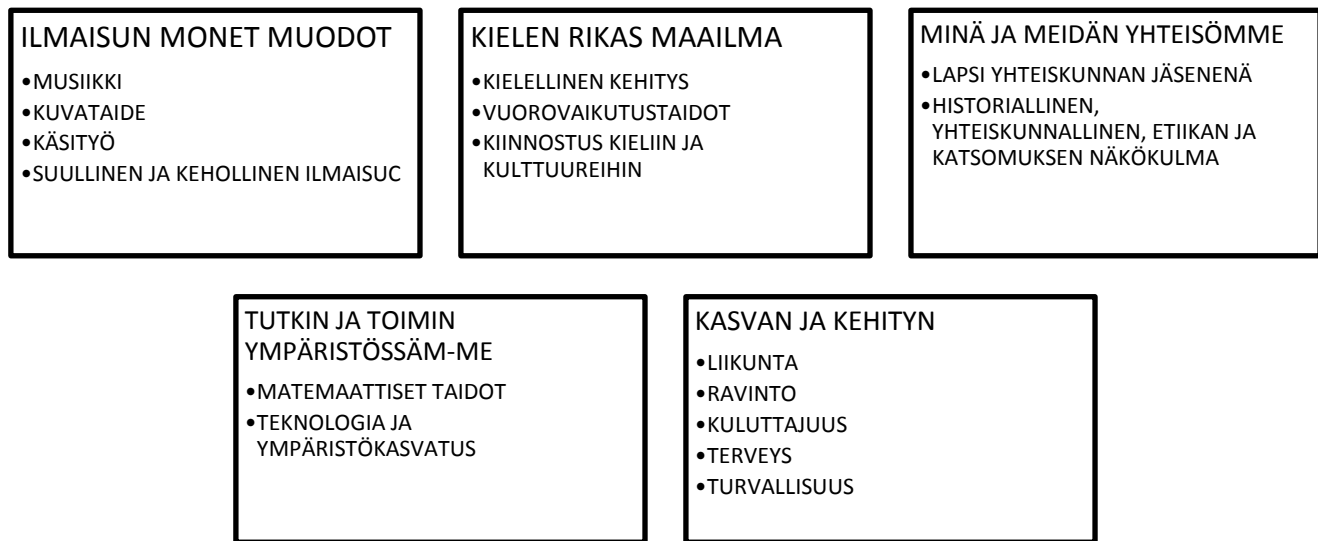
KUVIO 1 Esiopetuksen sisältöalueet

Opettaja voi esimerkiksi tukea lapsen kieltä ja vuorovaikutusta tarjoamalla mahdollisuuksia kirjoittamiseen, erilaisten kirjallisuuslajien lukemiseen ja kuuntelemiseen sekä antamalla aikaa lapsen omaehtoiselle vuorovaikutukselle opettaja-johtoisen toiminnan lisäksi lapselle valinnan mahdollisuuksia ja mahdollisuuksia jakaa ja osallistua vuorovaikutukseen. (Hoorn ym. 2011, 200–201)