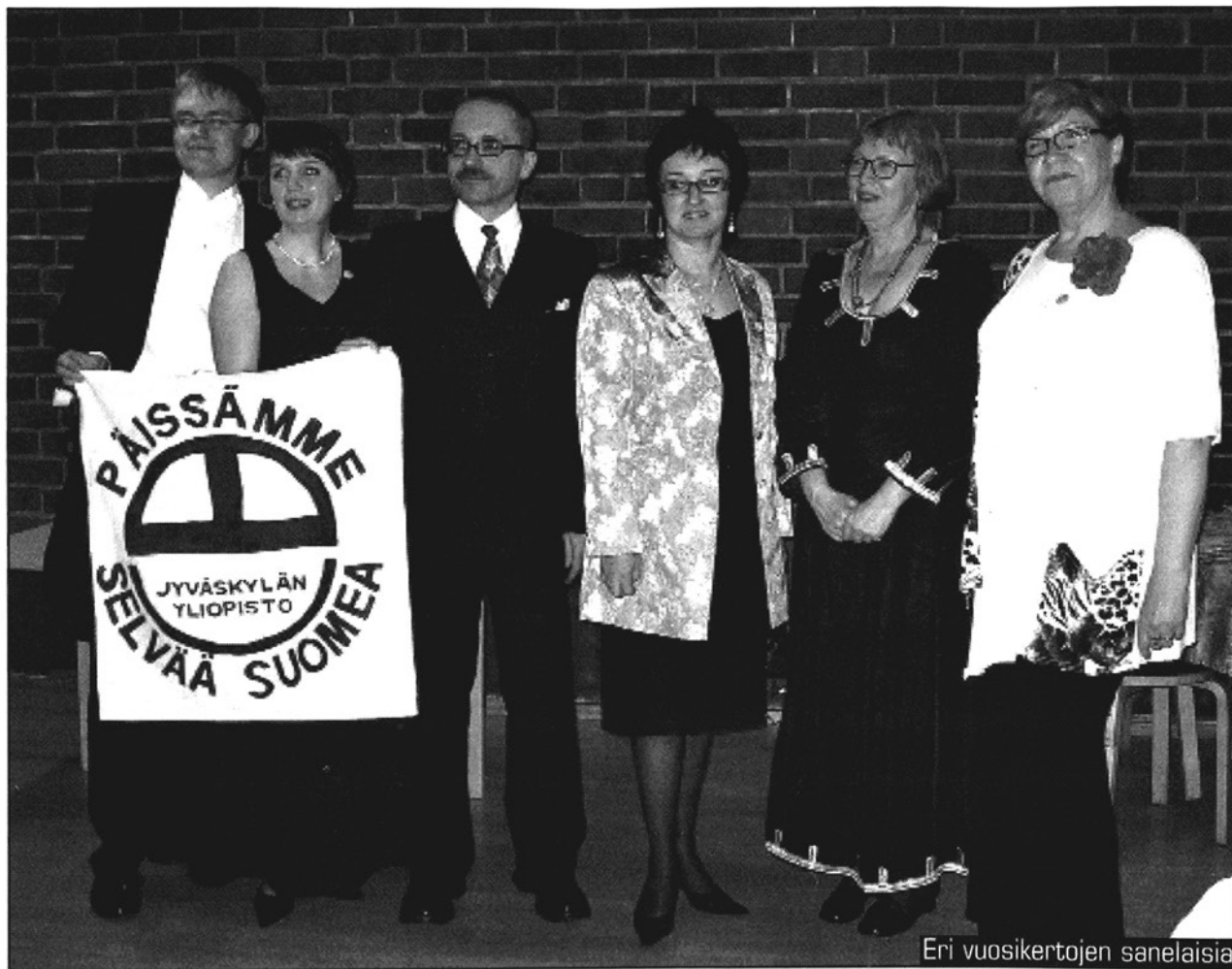
Eri vuosikertojen sanelaisia

OPISKELIJOILLE TAVALLISESTI arkisena näyttäytyvä ravintola Lozzi puettiin perjantaina 16. maaliskuuta juhlavampaan asuun, kun suomen kielten ainejärjestö Sane ry saavutti kunioitettavan 40 vuoden iän. Vaikka vieraita, Sanen entisiä puheenjohtajia, saapui jonkin verran kutsuttuja vähemmän, kehkeytyi vuosijuhlan tunnelmasta pian hersyvän iloinen ja tiivis.