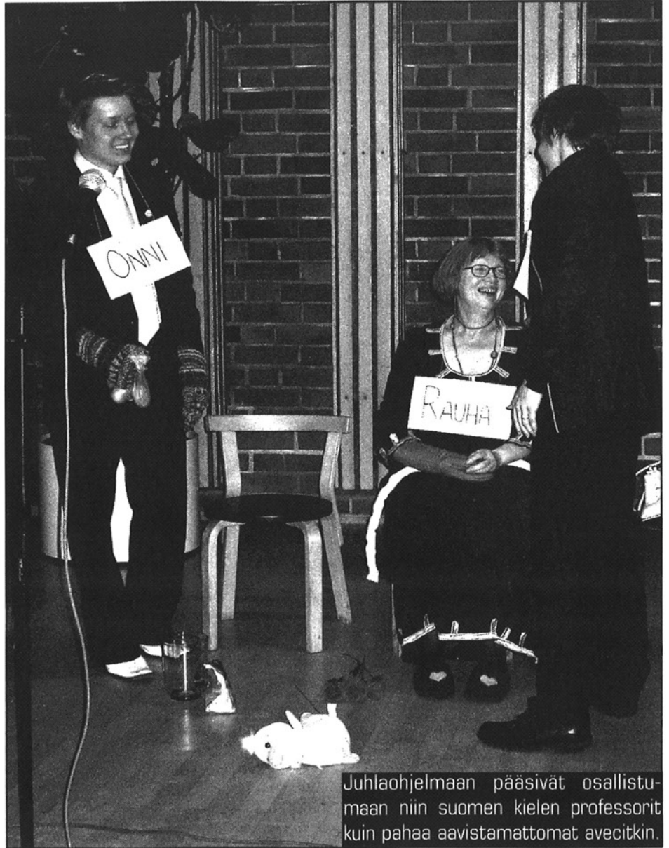
Juhlaohjelmaan pääsivät osallistumaan niin suomen kielen professorit kuin pahaa aavistamattomat avecitkin.

- Sittemmin tuli uutta kirjallisuutta ja