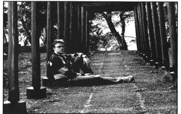
SIVU 10 FENNISTI JAPANISSA

6. VUOSIKERTA JULKAISIJA JYVÄSKYLÄN YLIOPISTON SUOMEN KIELEN OPISKELIJOIDEN AINEJÄRJESTÖ SANE RY. PÄÄTOIMITTAJAT JAANA KINNARI PAULIINA KYLÄ-UTSURI TOIMITTAJAT SANNA AHOKAS TUOMO ALA-KOJOLA MARI HARTIKAINEN PAULIINA HAUTALA VESA HOLM HELI HÄMÄLÄINEN MINNA KERÄNEN HENNA KOIVUNEN ANU KOSKIKERO MERJA NIEMELÄ RIIKKA NIUKKALA JARI PENNANEN KATI PENTTINEN TUURE PUURUNEN HILMA SALONEN MARIA SARHEMAA MERJA SUOMALAINEN TAITTO JA ULKOASU JAANA KINNARI PAULIINA KYLÄ-UTSURI KUVANKÄSITTELY JAANA KINNARI PAINOPAIKKA JYVÄSKYLÄN YLIOPISTOPAINO PAINOS 150 KPL