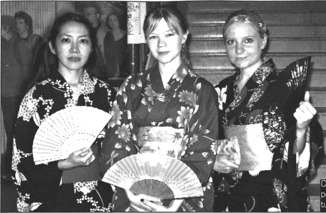
Conista löytyi myös pehmeämmän linjan pukeutumista

roimassa oli myös varsinainen tuomaristo sekä yleisöjuri. Kilpailijoita oli lisäksi paljon, joten kilpailussa meni pari tuntia, mutta se hurautti nopeasti ja lähinnä käsien jomotuksen kasvaminen kaikesta taputuksesta antoi viitteitä ajan kulusta.