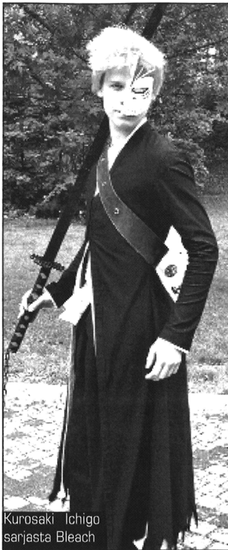
Kurosaki Ichigo sarjasta Bleach

LUKEMISTA HELPOTTAAKSENI aloitan maanitteluni pienellä sanastolla, jossa on oikeastaan kaikki olenainen. Tämän jutun keskeinen sana Animecon eli con tarkoittaa lyhykäisyydessään animekokousta, sillä täydellinen nimi olisi Animeconvention. Conissa animesta ja mangasta kiin-