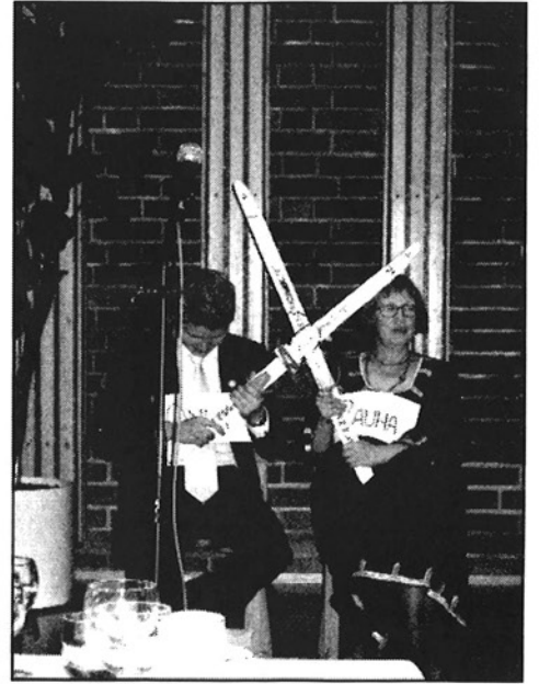
SIVU 4 SANE 40 VUOTTA