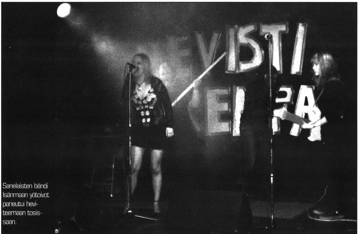
Sanelaisten bändi Isänmaan yötoivot paneutui hevi-teemaan tosissaan.

VIIMEINEN SIJA lankesi tänä vuonna Ranskan ainejärjestö Asterixille, joka viihdytti katsojia jopa kahdella eri kielellä sekä kuorotyttöillä, jotka ensimmäisen osuuden jälkeen riehaantuivat täydellisesti.