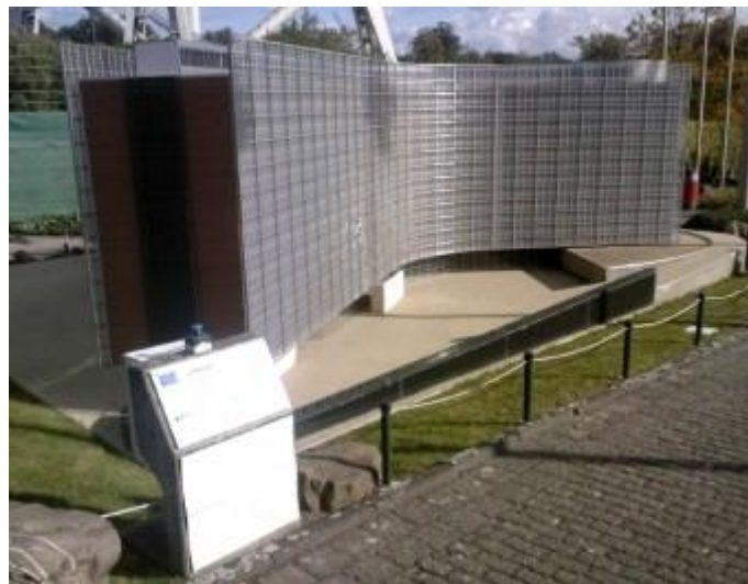
Kuva 2. Euroopan komission päämaja Berlaymont Brysselissä sijaitsevan Mini-Europe-teemapuiston ensimmäisenä pienoismallina.

EU:n kulttuuriperintöhankkeet ohjaavat tulkitsemaan paikallista ja alueellista kulttuuriperintöä osana eurooppalaista kulttuurista ja historiallista kontekstia ja sanoittamaan sitä EU:n kulttuuriperintöpolitiikan retorikan mukaisesti ”yhteisenä” ja ”jaettuna” eurooppalaisena kulttuuriperintönä. Hankkeissa pyritään konkretisoimaan abstraktin ja avoimen eurooppalaisen kulttuuriperinnön käsitettä hahmottamalla sen ilmenemistä paikallisella tasolla. Kulttuuriperinnön kiinnittäminen paikkoihin – paikantaminen – myös paikallistaa (localize) eurooppalaista kulttuuriperintöä. EU:n kulttuuriperintöhankkeet voidaankin nähdä siten sekä paikallisen kulttuuriperinnön eurooppalaistamisena että eurooppalaisen kulttuuriperinnön paikallistamisena.