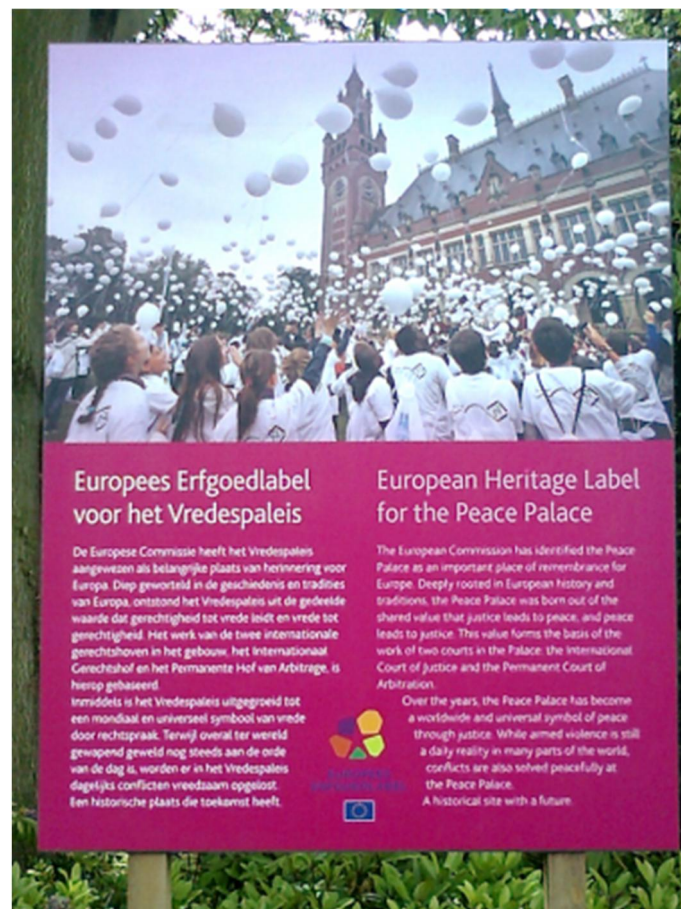
Kuva 3. Rauhan palatsi on Yhdistyneiden kansakuntien kansainvälisen tuomioistuimen päämaja Haagissa Alankomaissa. Rauhan palatsille myönnettiin Euroopan kulttuuriperintötunnus ensimmäisenä tunnuksen myöntämivuotena 2014. Euroopan komission myöntämästä tunnuksesta tiedotetaan sekä palatsin ulkopuolella että vierailukeskuksen näyttelytilassa.

Euroopassa sijaitsevat turistikset kulttuuriperintökohteet tuottavat monille ihmisille positiivisia mielikuvia ja tuttuuden tunnetta. Ikoniset turistikkohteet ovat kulttuurisia maabrändejä, jotka pitävät maita esillä niiden kulttuurin ja historian kautta. EU:n kulttuuriperintöhankkeiden pyrkimys kiinnostavien eurooppalaisten kulttuuriperintöpaikkojen tuottamiseen noudattaa samaa logiikkaa. EU hyödyntää kulttuuriperintöpaikkoihin liittyviä positiivisia mielikuvia ja siten tuottamaan mielikuvaa unionista kulttuurisena – ei vain poliittisena ja byrokraattisena – yhteisönä. Fyysiset kulttuuriperintöpaikat mahdollistavat EU:n näkyvyyden sekä paikoissa työskenteleville että niissä vierailleville yleisöille. Siksi EU edellyttääkin, että sen kulttuuriperintöhankkeisiin osallistuvien kohteiden tulee toiminnassaan tuoda esiin statusensa EU:n hankkeena (kuva 3). Etenkin Euroopan kulttuuriperintötunnukseen myöntämiseen ja Euroopan kulttuuriympäristöpäivien viettoon sisältyy yksityiskohtaisia ohjeita EU:n näkyvyydestä kohteissa logojen, lippujen ja sloganeiden kautta. EU:n näkyvyys kulttuuriperintöpaikoissa on symbolista vallankäyttöä. Näkyvyys merkitsee symbolisesti paikkojen 'omistajan' ja manifestoi EU:n hallinnollisen vallan ulottuvuutta kulttuurin, historian ja kulttuuriperinnön kentille.