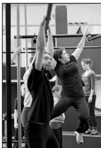
Tanssiteatteri Kramppi apinoi ja pitää jalat irti maasta. Sivut 14-15.