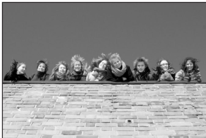
Sanen hallitus 2012 puhuu elämästä sivuilla 10-11.