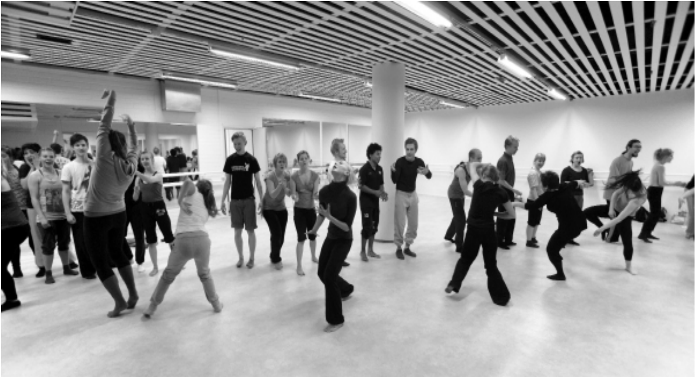
Krampin tanssijoita - vai Veronan nuoriso valmiina vuosituhaten suurimpiin naamiobileisiin?