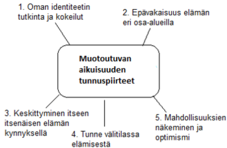
KUVIO 1. Keskeiset muotoutuvan aikuisuuden tunnuspiirteet Yhdysvalloissa Arnettin (2015, 9) tutkimusten mukaan.

Identiteetin rakennusprosessi on perinteisesti ajateltu kuuluvan ennen kaikkea nuoruuden kehitystehtäväksi: muun muassa Ahonen kollegoineen (2006, 143) käsittelee teoksessaan Eriksonin klassista teoriaa, jossa nuoren identiteetti rakentuu roolikokeilujen ja etsinnän kautta. Muotoutuvan aikuisuuden identiteetin etsintään kuuluu kuitenkin uravalinta-, rakkaussuhde-, ja elämäntilanteiden syventyminen, fokuoituminen ja etsinnän luonteen vakavoituminen suhteessa nuoruuteen (Arnett 2000, 473). Muotoutuva aikuisuus suo vapaammat kädet mahdollisuuksien kartoittamiseen ja itsestä selvyteen pääsemiseen (Furstenberg, Rumbaut & Settersten 2005). Kuitenkin nuoruudelle ominainen huolettomuus on edelleen läsnä myös nuorten aikuisten identiteetin etsinnän taipaleella. Ainutlaatuisesta elämäntilanteesta halutaan ottaa kaikki irti, ja kehitysvaiheen kokeilut koetaankin mielekkäänä hauskanpitoa ja kokemusten kartuttamisena ennen aloilleen asettumista (Arnett 2015, 10). Muotoutuvan aikuisuuden identiteetin muokkausprosessin asenteena on ”nyt tai ei koskaan” (Ravert 2009).