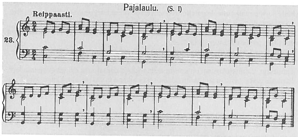
Kuva 4. Pajalaulu (1910), sovittanut A. Törnudd.

yksinkertaisia. Ne oppii helposti, eikä säestäminen estä opettajaa samalla tarkkailemasta luokan laulua. (Apostol 1910.)