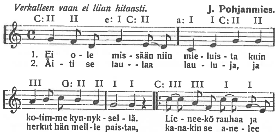
Kuva 6. Kodin kynnyks (Pohjanmies 1945a, 6).

Juhani Pohjanmiehen Kootut lastenlaulut vuodelta 1945 on ensimmäinen laulukirja, jossa on sointumerkit, itse asiassa sointuastemerkit. Sointuastemerkinään löytyy perustelu Pohjanmiehen kehittämästä priimisoittimesta, säestyssoittimesta koulukäyttöön (Pohjanmies 1945b), jonka käyttöä koulusoittimena kuvaa Arvo Vainio (1935). Priimisoitin muistutti virsikannelta ja Pohjanmiehen ajatuksena oli priimisoitinperheen käyttö luokkasoittimena. Pohjanmies kehitti koulun lauluopetuksen tueksi myös melpopianon. Sen tarkoituksena oli mm. poikien innostaminen musisoimaan koulun laulutunneilla. (Vainio 1937.)