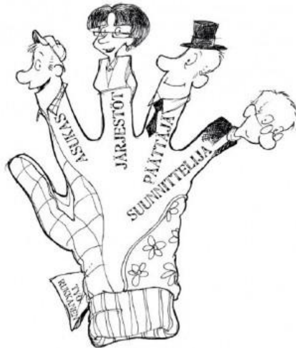
Kuva 1.1. Kuvitusta Kulttuuriympäristöohjelma – miten ja miksi -oppaasta (2009). Piirroksat: Pekka Rahkonen

Ensimmäisenä varsinaisena maakunnallisena kulttuuriympäristöohjelmana voidaan pitää Varsinais-Suomen kulttuuriympäristöohjelmaa, jonka Turun ja Porin lääninhallitus julkaisi vuonna 1995. [6] Sitä ennen toteutettiin ympäristöministeriön rahoittama kokeiluvaihe, jonka puitteissa valmistuivat vuonna 1992 Keski-Suomen alueellinen rakennetun ympäristön hoito-ohjelma ja Varsinais-Suomen alueellisen rakennusperinnön hoito-ohjelmakokeilun raportti ja vuonna 1993 Kymenlaakson kulttuuriympäristöjen toimenpideohjelma . Kokeiluvaiheeseen sisältyi myös vuonna 1994 valmistunut kuntakohtainen Valtimon kulttuuriympäristöohjelma . Ohjelmien laatimisesta vastasivat kullakin alueella jo toimivat tai ohjelmatyötä varten perustetut yhteistyöryhmät. Varsinais-Suomen rakennuskulttuuriyöryhmä oli perustettu jo vuonna 1982. Siihen kuului jäseniä Varsinais-Suomen liitosta, läänin taidetoimikunnasta, lääninhallituksen ympäristöosastolta, Turun maakuntamuseosta ja Museovirastosta sekä aluearkkitehtejä, rakennus- ja maaseutuelinkeinopiirin edustajia. [7] Keski-Suomessa rakennussuojelutoimikunta aloitti vuonna 1987 maakunnallisena rakennussuojelun yhteistyöryhmänä. [8] Kymenlaakson rakennussuojelun asiantuntijaryhmä perustettiin vuonna 1989. Kokoonkutsujana toimi Kymenlaakson seutukaavaliitto ja siihen kuului lääninhallituksen, seutukaavaliiton ja maakuntamuseon edustajia. Ryhmä nimesi ensimmäiseksi tehtäväkseen toimenpideohjelman laatimisen.