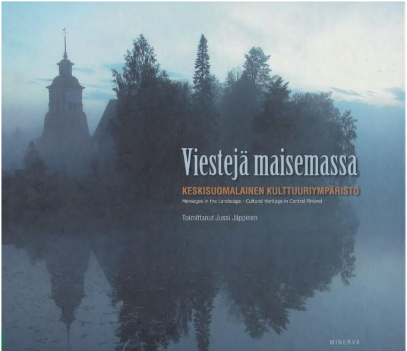
Kuva 2. Viestejä maisemassa. Keskisuomalainen kulttuuriympäristö -kirjan kansi.

maisemaa, sekä kirjan nimessä että kuvituksessa. Kirjan kansikuvassa Unescon maailmanperintökohde Petäjäveden kirkko on kuvattu usvaisessa maisemassa. Itse kirkko jää kuvassa suurimmaksi osaksi puiden taakse ja hautausmaan piirteet ovat vain vaivoin erotettavissa usvaisesta maisemasta. Kuvaa hallitsee taivas, vesi ja puusto, joka heijastuu myös tyyneen veden pintaan. Kirkon kellotapuli erottuu kuvassa ”viestinä maisemassa” ja myös se heijastuu vedenpintaan. Kirjassa on paljon panoraamakuvia, jota korostavat kirjan tavoitetta luoda kokonaiskuvaa keskisuomalaisesta kulttuuriympäristöstä. Maisemapainotuksen lisäksi kirjassa näkyy ohjelmatyössä 2000-luvulla voimistunut maakuntaidentiteetin korostaminen. Kirjassa kiinnittääkin huomiota, että kulttuuriympäristö-sanaa käytetään yksikössä: kirjassa pyritään luomaan kuvaa Keski-Suomen kulttuuriympäristöstä . Satakunnan kirjassa käytetään monikkoa ja puhutaan Satakunnan kulttuuriympäristöistä .