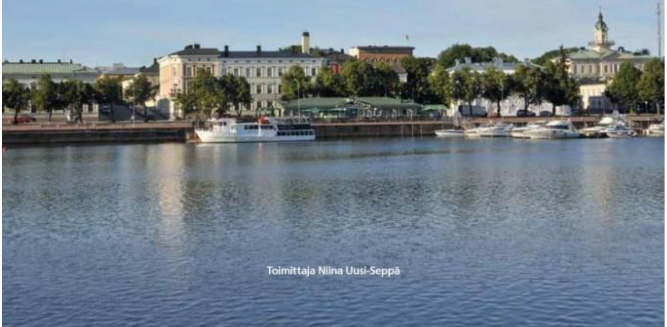
KUVA 3. Satakunnan kulttuuriympäristöt -kirjan kansi.

Keski-Suomen ja Satakunnan kirjoja yhdistää ympäristökasvatuksellinen (Keski-Suomen kirjassa oppikirjamainenkin) ote. Molemmat kirjat on toteutettu pääasiassa maakuntamuseon, yliopiston ja paikallisten ympäristöviranomaisten yhteistyönä. Keskeiset sisällölliset erot ovat osittain kytköksissä julkaisuajankohtaan. Keski-Suomen kirjan rakennusperintöosuudessa ei ole erikseen huomioitu modernin arkkitehtuurin kohteita. Moderniin rakennusperintöön liittyvät kysymykset ovat olleet esillä museotyössä jo 1980-luvulta alkaen, mutta inventoinnit ovat käynnistyneet pääasiassa vasta viime vuosina. Osallistuminen ja asukasnäkökulma ovat myös teemoja, jotka ovat tulleet vahvemmin mukaan keskusteluun ja myös ohjelmatyöhön viime vuosina. Toinen ero liittyy kirjojen kuvitukseen. Satakunnan kirjan kuvat ovat kohdekuvia arvokkaiksi määritellyistä rakennuksista, arkeologisista tai kulttuuriympäristökohteista. Keski-Suomen kirjan kuvat pyrkivät ohjaamaan myös arvokohteita laajempaan ympäristön tarkasteluun.