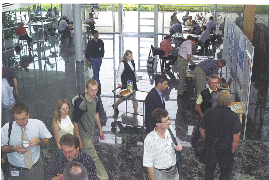
Agora osoittautui riittäväksi yli tuhannen ihmisen kokoukseen. Suuret yhteisluennot pidettiin Kongressikeskus Paviljongissa.