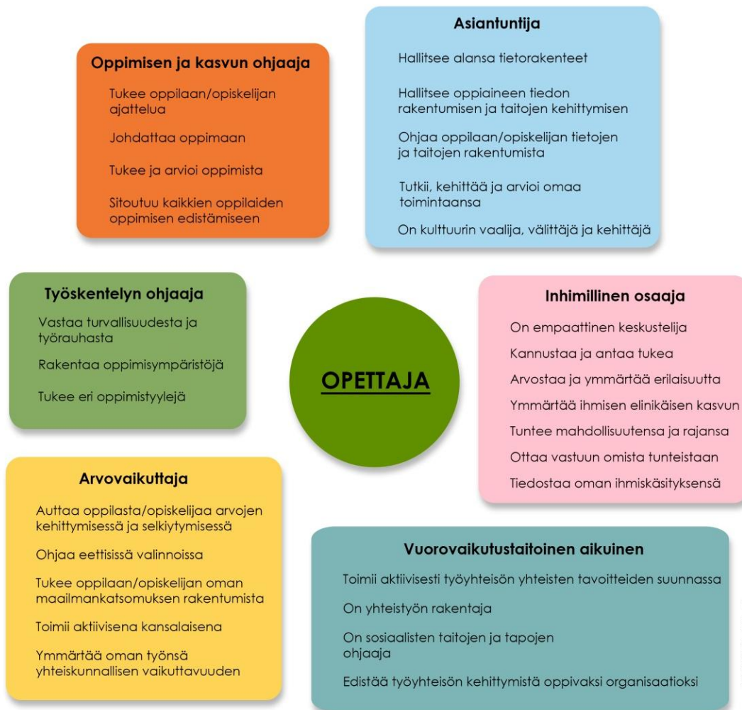
Kuva 1. Opettajuuden roolikartta.