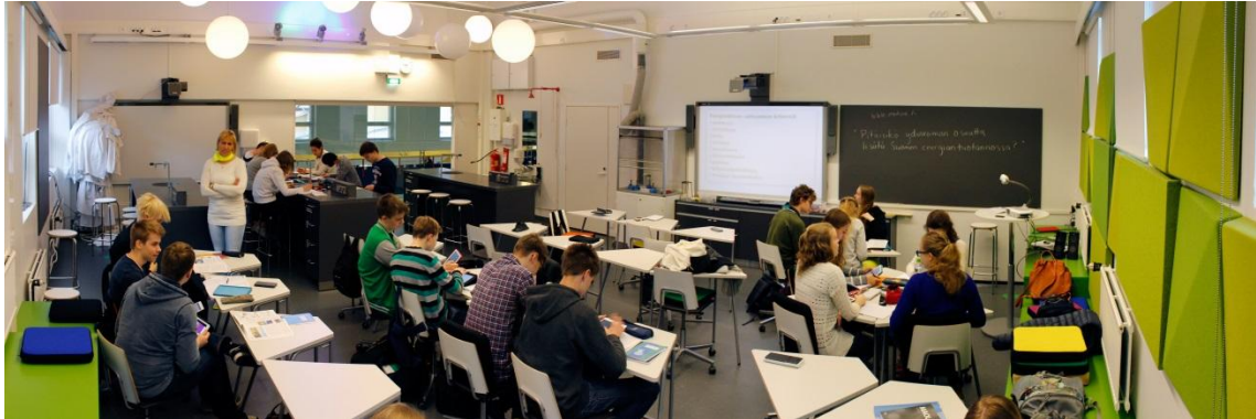
Kuva 4. Normaalikoulun moderni oppimisympäristö, uudistettu fysiikan ja kemian luokkatila.

Kaikilla ainelaitoksilla opiskelija voi tehdä opinnäytetyönsä, kandidaatintutkielman, pro gradu -tutkielman ja erikoistyön opetukseen liittyvistä tutkimusaiheista. Myös kasvatustieteen pedagogisiin aineopintoihin sisältyy pienimuotoinen kasvatustieteellinen tutkimus, missä opiskelija tutustuu opetukseen liittyvän tutkimusprosessin suunnitteluun, toteutukseen ja raportointiin. Ainedidaktisen ja pedagogisen tutkimuksen tekeminen auttaa tulevaa opettajaa näkemään ja ratkomaan oppimiseen liittyviä ongelmia sekä kehittämään oppimisen ja opetustyön analysoinnissa. Osa opettajaksi valmistuvista jatkaa opetuksen tutkimuksen parissa myös jatko-opinnoissaan. Esimerkiksi Jyväskylän yliopiston Agora Centerin Indoor Environments -tutkimushanke näkyy konkreettisesti opetusharjoittelua suorittavan opiskelijan arjessa. Tutkimushankkeessa opetusharjoittelijoita on osallistunut modernin oppimisympäristön suunnitteluun Jyväskylän Normaalikoululla. Käyttäjälähtöinen suunnittelu eteni lukiolaisten ideoimista tilaratkaisuista opiskelijoiden ja henkilökunnan kehitysideoiden kautta ammattilaisten suunnittelupöydälle viimeistelyyn. Uudentyyppinen fyysinen oppimisympäristö mahdollistaa monimuotoisen vuorovaikutuksen (kuva 4). Oppimistilan laborointialue ja työskentelyalue sekä luokan lasiseinän takana olevat oppimiseen varustetut käytävätilat muodostavat yhtenäisen oppimisen tilan, jota voidaan käyttää sekä yksilöidysti eriyttäen että rytmittämään oppituntien sisältöä mielekkäästi.