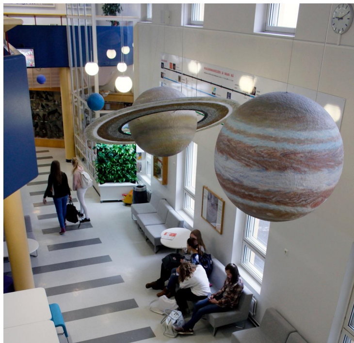
Kuva3. Aurinkokuntamalli informaalisena oppimisympäristönä Jyväskylän Normaalikoulussa.

Pedagogiset ja ainedidaktiset tiedot ja taidot kehittyvät pedagogisissa opinnoissa, joihin nivoutuvat keskeisenä osana Normaalikoululla tehtävät ohjatun harjoittelun opintojaksot. Aineenopettajaksi valmistuva maisteri saa opintojensa aikana tietoa ja kokemusta oppilaiden kohtaamisesta, vuorovaikutuksesta oppimisympäristöissä, oppimiseen liittyvistä ongelmista sekä opetettavalle aineelle luonteenomaisista monipuolisista opetusmenetelmistä.