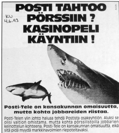
Kuva 1. Suurten liikelaitosten yhtiöittäminen kosketti kymmeniä tuhansia työntekijöitä ja herätti ristiriitaisia tunteita myös laajassa yleisössä. Erään suuren ammattiliiton ilmoitus Kansan Uutisissa 4.6.1993.

tiin valtion posti- ja telelaitoksen vahvistamista ulkomaisia kermankuorijoita vastaan. Jo ennestään " Kauppalehteä lukevalle" laitoksen johdolle oli annettava keinot vastata kilpailuun. 44 Liikelaitosuudistus toteutui posti- ja telelaitoksen kohdalla vuoden 1990 alusta.