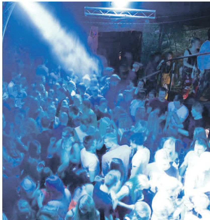
Aika näyttää, muodostuuko 3MIOT-bileistä vai Poikkiteieteellisistä haalaribileistä Jyväskylän ykköshipat. Kuva helmikuun Poikkiteieteellisistä haalaribileistä.

Katso lisätiedot osoitteesta: juu.fi/it/opiskelijavalinta