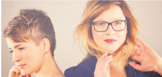
PETE EKLUND / JAANI KIVINEN

Kolmen näyttelijän kollektiiviohjaus vyöryttää näyttämölle henkilögallerian riutuvasta pienileikkisestä kirjailijasta loisteliaaseen tähdenlentoa ja kustannustoi- mittajasta hyväksikäytettyihin sukulaisiin.