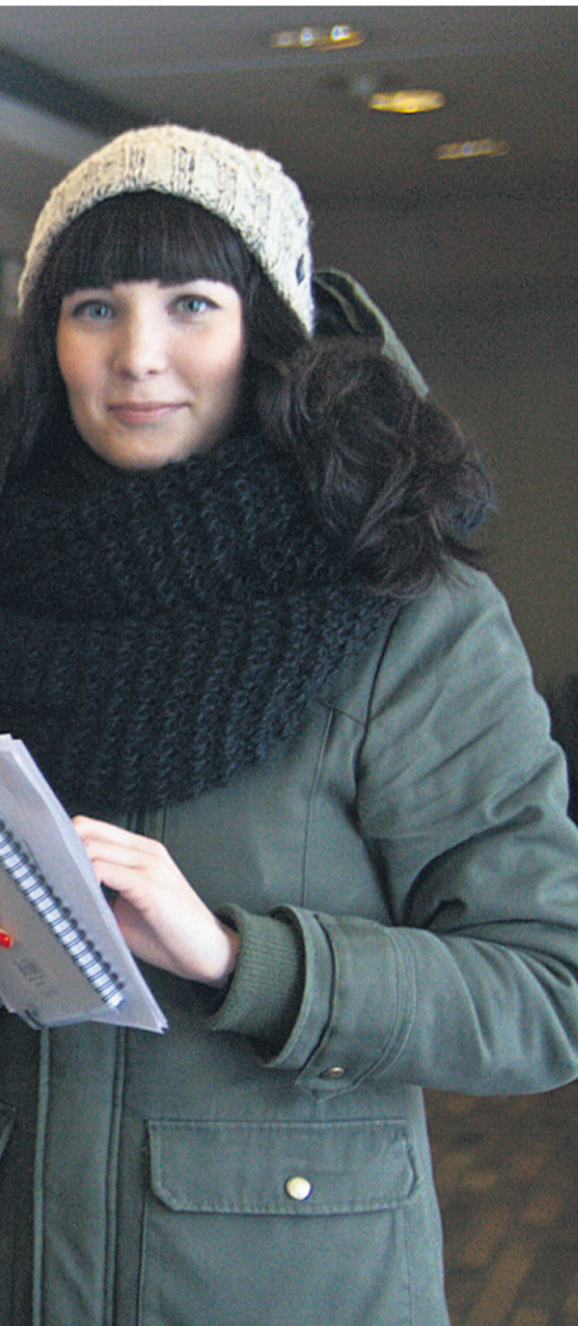
äässä yliopistolle, mutta toivovat, että Suomen koulu-

jaan vielä epävarmempi. Tämä vaikeuttaa Pitkäsän mukaan työtä yliopistolla ja asettaa hakijan oikeusturvan kyseenalaiseksi.