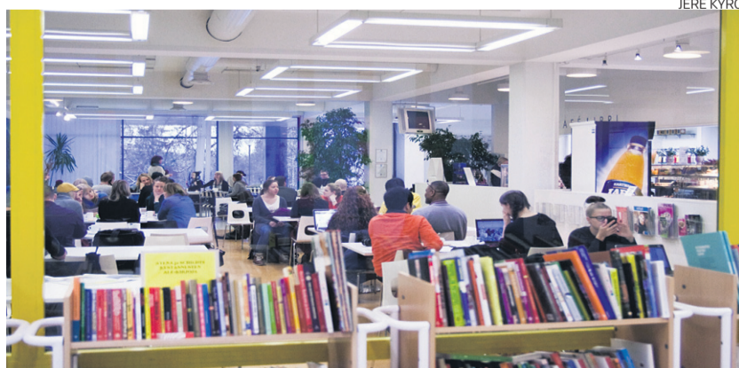
Alunperin saamasta tiedostamme poiketen, väistöravintola tuleeikin kurssikirjaston tilaan, eikä kuvassa näkyvän Café Librin paikalle.

”MINUSTA LAKI EI YLIOPISTO-OPISKELUUN SOVELLU.”