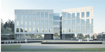
Arkkitehtitoimiston näkymäkuva uudesta yliopistorakennuksesta