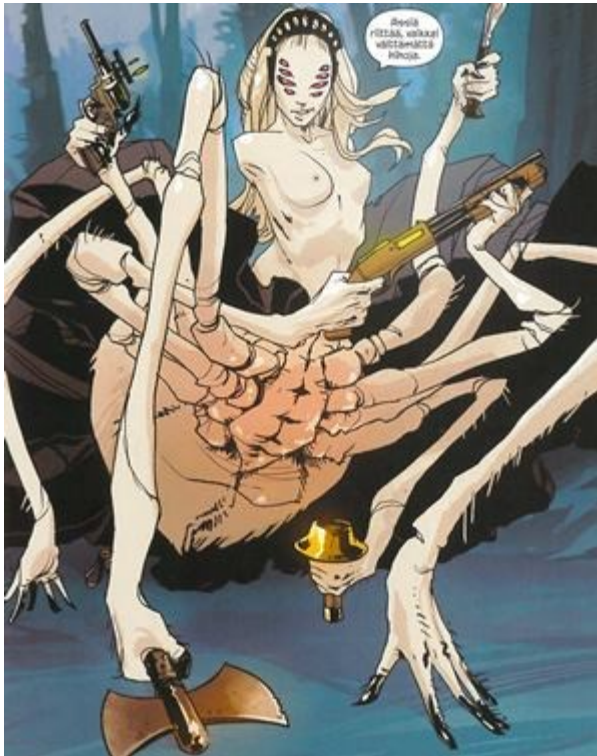
Vaughanin ja Staplesin visuaalisesti kekseliästä hahmodesignia parhaimmillaan (Saga # 2, s. 17.)

hybridihahmoissakaan ei ole menty perinteisimmän kautta: kun sivua kääntäessään löytää upeasti antropomorfisoidun hämähäkin tai kumisaappaissa taapertavan kuutin, on vaikeaa olla ilahtumatta. Suurimmaksi fanisuosikiksi tuntuu kuitenkin nousseen Valhetassu, massiivinen Sfinx-kissa, joka tietää, milloin joku valehtelee ja myös ilmoittaa sen ääneen. Juuri hahmoissa Vaughanin monet ideat ja Staplesin kyky lihallistaa ne yhdistyvät hienolla tavalla, ja saavat lukijan odottamaan seuraavaa albumia.