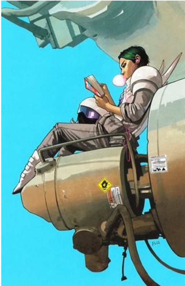
Arkea avaruussodan keskellä (Saga #8,