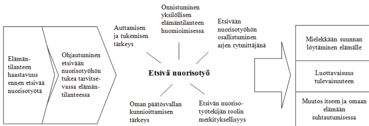
KUVIO 2. Nuorten kokemukset etsivästä nuorisotyöstä ja sen merkityksestä elämäkululle

Analyysin tuloksena muodostui yksi yleinen merkitysverkosto etsivään nuorisotyöhön liittyvistä kokemuksista ja seitsemän yleisen merkitysverkoston tyyppiä liittyen kokemuksiin etsivän työn merkityksestä elämäkululle. Kuviossa 2 esitän merkitysverkostojen sisältöalueet. Kuvio havainnollistaa merkitysverkostojen sisältöä suhteessa toisiinsa ja kokonaisuuteen.