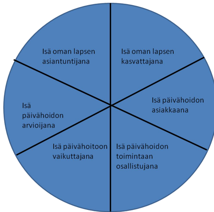
KUVIO 1 Isän eri roolit päivähoitossa