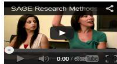
How can an undergrad use SAGE Research Methods?