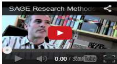
An Introduction to SAGE Research Methods