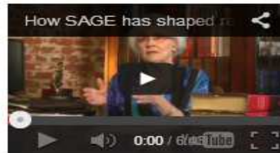
How SAGE has shaped research methods