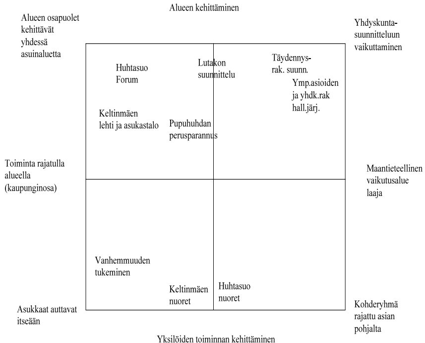
Kuvio 1. Sosiaalityöntekijöiden toimintatavat.

Sosiaalityöntekijöiden toimintatapoja paikallisen tason toimijana ja vaikuttajana voidaan jäsentää kuviossa 1 osoitetulla tavalla.