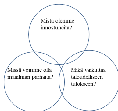
KUVIO 2. Siilikonseptin kolme kehää (Collins 2003, 143).

Kirjoittaja tarvitsee läpimurtoa saavuttaakseen riittävän tulotason. Jos hän ei saa apurahoja eikä hänellä ole riittävästi tuloa tekijänoikeuskorvauksista, kirjoittaja on pakotettu etsimään muuta työtä. Rensujeff mainitsee, että matala tulotaso ja rahallisten palkkioiden saaminen viiveellä ovat erittäin yleisiä ilmiöitä taiteellisen työn tekijöiden kohdalla. (Rensujeff 2003, 38.)