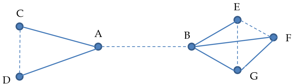
KUVIO 1. Vahvat ja heikot siteet (mukautettu Granovetter 1973, 1365)

Granovetterin (1973) teoriaa havainnollistetaan kuviossa 1, jossa kuvataan kahden verkoston välisiä siteitä. Vahvat siteet on merkitty yhtenäisillä viivoilla, ja heikot siteet katkoviivoilla. Tiedonkulun kannalta merkittävänä on henkilöiden A ja B välinen side. Tämän siteen poistaminen vaikuttaisi merkittävästi tiedon kulkeutumiseen toisin kuin esimerkiksi B:n ja G:n välisen siteen poistaminen, sillä informaatio heidän välillään voisi kulkea vielä joko henkilöiden F tai E välityksellä. Kuviossa heikko side henkilöiden A ja B välillä toimii myös siltana, sillä se on ainoa reitti näiden kahden verkoston välillä. Henkilöillä A ja B molemmilla on omissa verkostoissaan vahva side kaikkiin muihin verkostoon kuuluviin henkilöihin, jolloin heidän kauttaan tieto välittyy nopeasti eteenpäin koko verkostoon. Sen sijaan taas esimerkiksi side henkilöiden A ja C välillä ei täytä sillan määritelmää, sillä informaatio heidän välillään voi kulkea myös henkilön D välityksellä. Jos taas henkilöiden A ja B välillä olisi vahva side, olisi todennäköistä, että nämä kaksi verkostoa yhdistyisivät toisiinsa myös muiden henkilöiden välityksellä – käytännössä esimerkiksi henkilöllä C olisi side henkilöön B. Tämä perustuu siihen, että vahvalla siteellä samaan henkilöön yhdistyvät yksilöt linkittyvät todennäköisemmin myös toisiinsa. (Granovetter, 1973.) Tässä tapauksessa siis henkilöiden A ja B välinen vahva side ei toimisi enää siltana. (kuvio 1.)