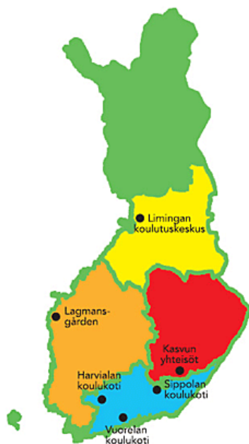
Kuva 2. Valtion koulukodit Suomen kartalle sijoiteltuna (THL 2013b).

Valtion koulukoteja on tällä hetkellä kuusi. Koulukotien pitkän historian takia moni koulukoti on ollut samalla paikalla jo pitkään. Limingan koulukoti on suomen vanhin. Lagmansgårdenin, Sippolan ja Vuorelan koulukodilla sekä Kasvun yhteisöllä on yli 100-vuotinen historia. Myös Harvialan koulukoti on toiminut paikallaan jo yli 60 vuotta. (THL 2013d.)