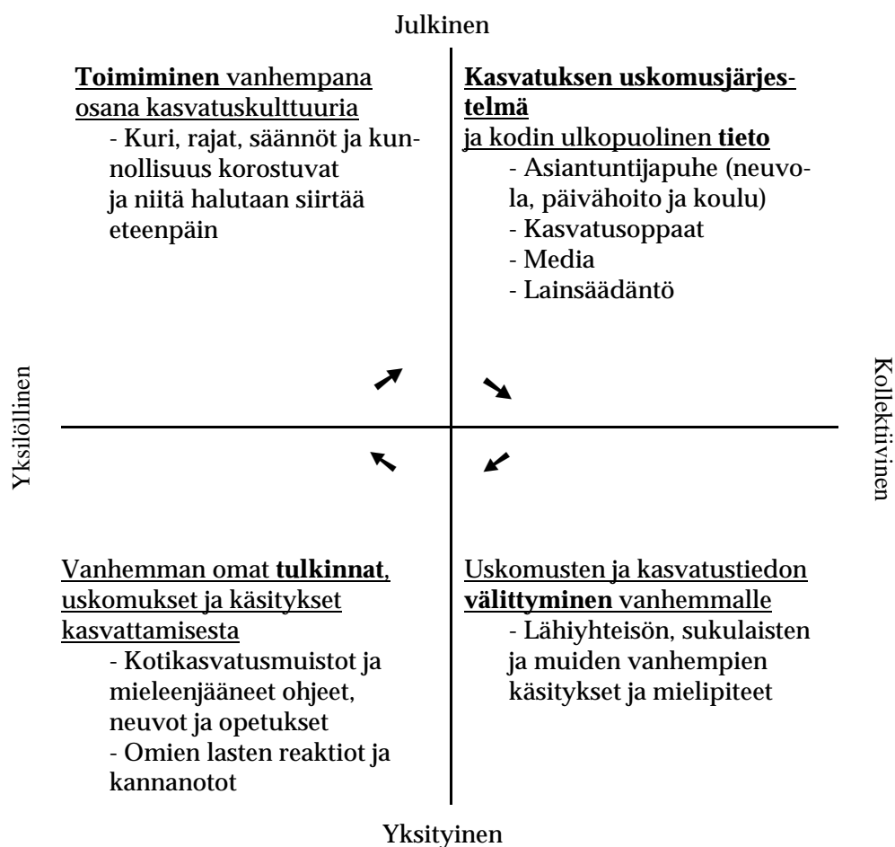
KUVIO 2 Kasvatusajattelun siirtymät julkisesta yksityiseen ja kollektiivisesta yksilölliseen

Tässä yhteydessä on vielä syytä pohtia, mistä eri tekijöistä vanhempien kasvattajana toimiminen rakentuu ja mitkä tekijät suuntaavat vanhempien kasvatustoimintaa. Sovellan pohdinnassani Harrén (1984, 180) esittämiä ulottuvuuksia merkityksen muodostumisessa ja muuttumisessa. Nämä ulottuvuudet ovat julkinen – yksityinen ja kollektiivinen – yksilöllinen. Kuvioon 2 olen yhteenvedonomaaisesti koonnut tutkimukseni teoreettisten lähtökohtien ja tulosten pohjalta vanhemmuutta ja kasvattamista kuvaavia tekijöitä.