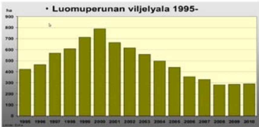
Taulukko 4: Luomuperunan viljelyala Suomessa vuosina 1995-2010. Lähde: evira.fi.

Maatalousneuvojat MTK:lla toteavat, että peruna sopii luomukiertoihin monia muita kasveja heikommin taudinuhasta johtuen (Asiantuntijahaastattelu IV, 2012). Haastattelemamme luomuviljelijät taas ajattelevat perunan tautiherkkyyden johtuvan siitä, että konventionaalisilla tiloilla viljelykiertoa ei juuri toteuteta (Haastattelut Pohjois-Karjala 2011; Haastattelut Uusimaa 2011). Tämän ristiriidan ratkaiseminen on tämän artikkelin tavoittamattomissa, mutta kuvastaa yhtä jännitettä maatalouspolitiikan keskusteluissa, joiden materialisoituvat tulkinnat ohjaavat tukipäätöksiä perunan tuottamisen ehdoista ja perunan ekologioista tulevaisuudessa. Esimerkiksi Ruotsissa luomuperunan tuotannosta saa asiantuntijahaastattelun mukaan korkeampia maataloustukia (Asiantuntijahaastattelu III, 2012). Tyrnävällä kiistoja on jo esiintynyt luomu- ja siemenperunantuottajien välillä, koska ruiskuttamattomat luomupellot nähdään tautien osalta puhtaan siemenperunan riskitekijänä (Asiantuntijahaastattelu IV, 2012). Riskien vähentämiseksi siemenperunan tuottajat ovat käyneet vapaaehtoisesti ruiskuttamassa kasvin-, tuholais- ja sienentorjunta-ainein muiden viljelijöiden perunapelloja. Konkreettisia hallintatoimenpiteitä on harkittu kaikille perunantuottajille myös viranomaisten keskuudessa. Eräs haastateltava suosittelee perunan