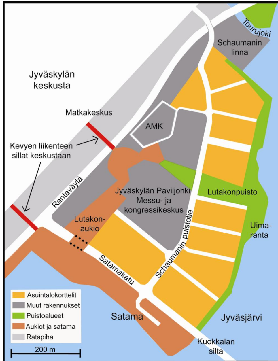
KUVA 2 Lutakon kartta