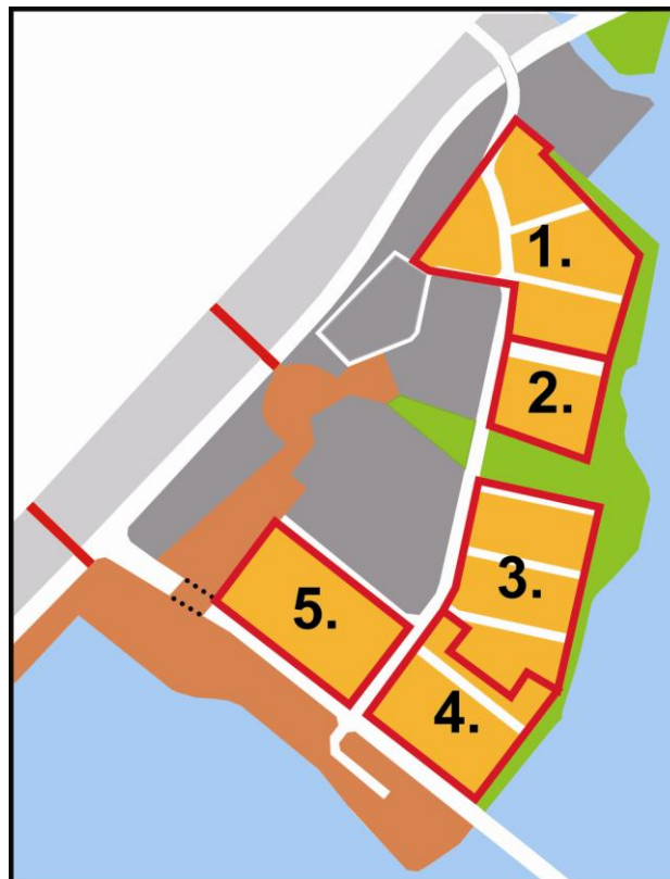
Kuva 4 Toteutusaluejako

”Mitä tälle hirvittävälle alueelle tapahtuu ja mitä tänne syntyy (...) tehdas oli ajettu alas ja alue täynnä erinäköstä epäkuranttia rakennusta” (Mikko Rätty, YIT Rakennus Oy)