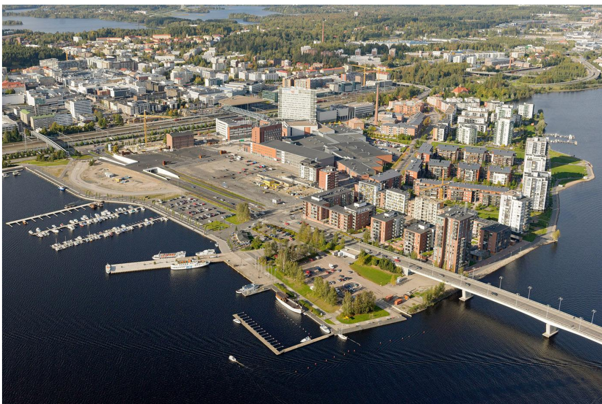
KUVA 1 Lutakko kesällä 2012

Schaumanin lopetettua toimintansa on tehtaan tilalle Lutakkoon noussut nyt moderni ja vetovoimainen asuin- ja työssäkäyntialue (Kuva 1). Lutakon projekti on ollut tärkeä osa koko kaupungin elpymistä 1990-luvun vaikeasta talousahdingosta kohti uutta kasvua. Lutakko toimii kaupungin komeana julkisivuna ja on kaupunkilaisten suosima virkistysalue. Lutakossa käydään myös töissä ja opiskelemassa sekä viihtymässä erilaisissa vapaa-ajan tapahtumissa. Lutakko on alueena selkeärajainen ja sijainniltaan houkutteleva. Lutakko on vireä ja esimerkiksi Mtv3:n Joka Kodin Asuntomarkkinat -ohjelman vuoden 2009 asuinaluekilpailussa korkealle arvostettu (Mtv3 2009). Alue on edelleen keskeneräinen, mutta rakentaminen on loppusuoralla ja alueen lopullinen hahmo ja rakenne ovat jo tiedossa. Näin ollen on mahdollista arvioida Lutakon suunnitteluprojektia ja syntyneitä ”uutta Lutakkoa”.