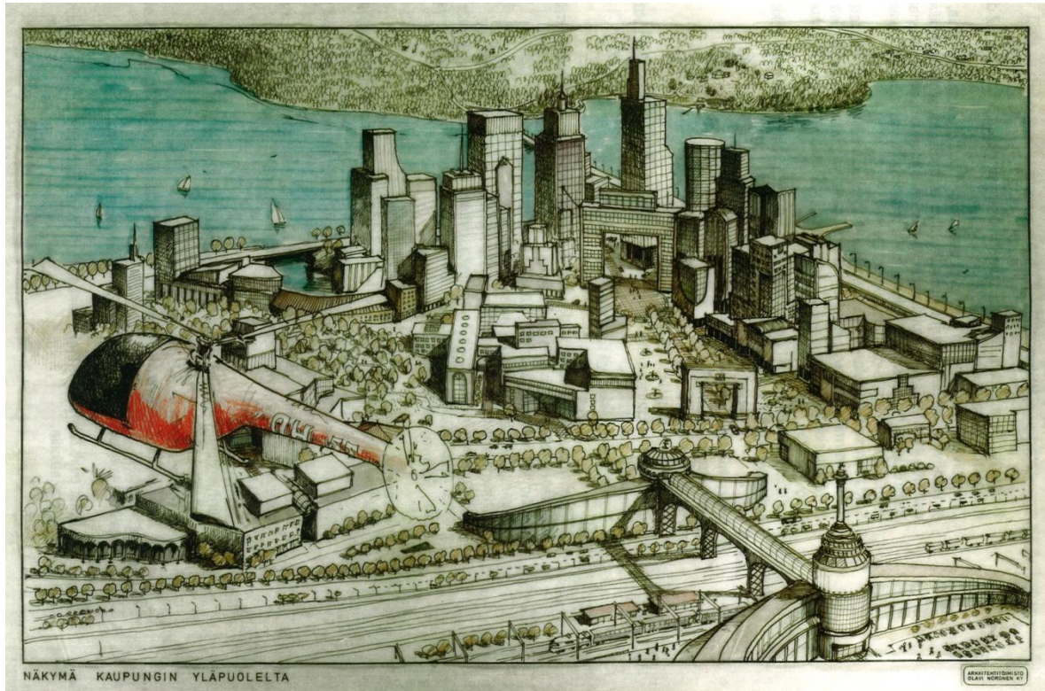
KUVA 3 Havainnekuva tehtaan vuonna 1986 teettämästä ”Manhattan-suunnitelmasta”