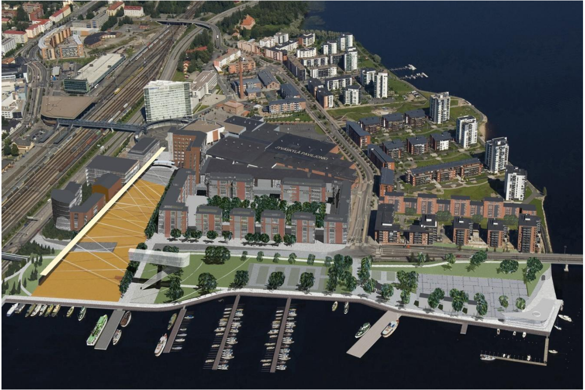
KUVA 6 Havainnekuva valmiista Lutakosta

Lutakossa oli vuoden 2011 lopussa 2680 asukasta ja noin 1700 asuntoa. Viimeisen vaiheen asuintalojen valmistuttua Lutakossa asuu noin 3500 ihmistä (Moisio 2012). Taulukossa 1 on esitetty Lutakon tarkempia väestötietoja ja vertailtu näitä lukuja muun kantakaupunkialueen ja koko Jyväskylän vastaaviin lukuihin. Väestötietojen vertailussa Lutakon kohdalla merkille pantavaa on pieni työttömyysaste sekä korkeakoulutettujen suuri osuus ja keskitulojen korkeampi taso vertailukohteisiin nähden. (Jyväskylän kaupunki, Asuntotoimi 2012; Jyväskylän kaupunki, Sosiaali- ja terveystoimi 2012; Jyväskylän kaupunki, Tietoa Jyväskylästä suuralueittain 2012.)