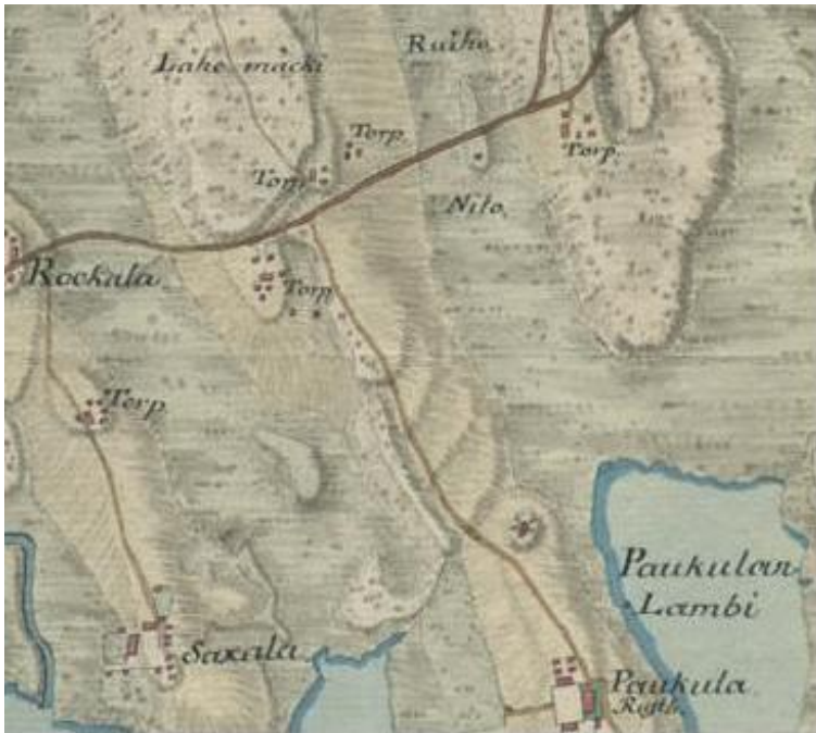
Kuva 3. Lähemäen sijainti 1700-luvulla (kartta on Ruotsin Sota-arkistosta 1700-luvulta).