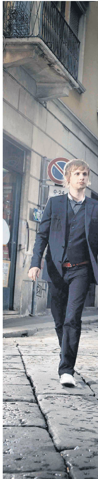
Muse on kulkenut pitkän tien eturivin yhtyeeksi.

TOISSA VUONNA MUSE teki kappaleen elokuvan Twilight – Epäily soundtrackille. Neutron Star Collision (Love is Forever) on pe-