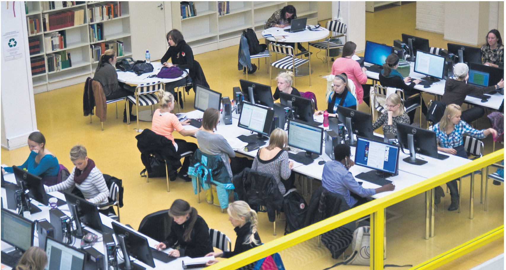
teksti Tiina Saari