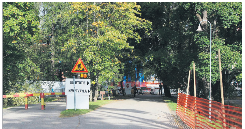
Hallintorakennuksen työmaa vaikeuttaa kampuksella liikkumista.