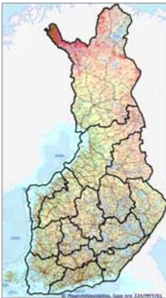
Kuvio 2. Riistanhoitopiirit Suomessa

Metsästäjäorganisaation paikallisaluetasolla toimiva yksikkö on riistanhoitopiiri. Piirien lukumäärä on 15 ja niiden toiminta-alueet määrätään asetuksella. Alueellisesti ne vastaavat suunnilleen vanhaa läänijakoa. Riistanhoitopiirin toimintaa johtaa riistapäällikkö ja hänellä on myös apunaan useimmissa piireissä riistanhoidonneuvoja. Piirit ovat Metsästäjien Keskusjärjestön valvonnan ja ohjauksen alaisia. ( http://www.riista.fi/?mag_nr=10 )