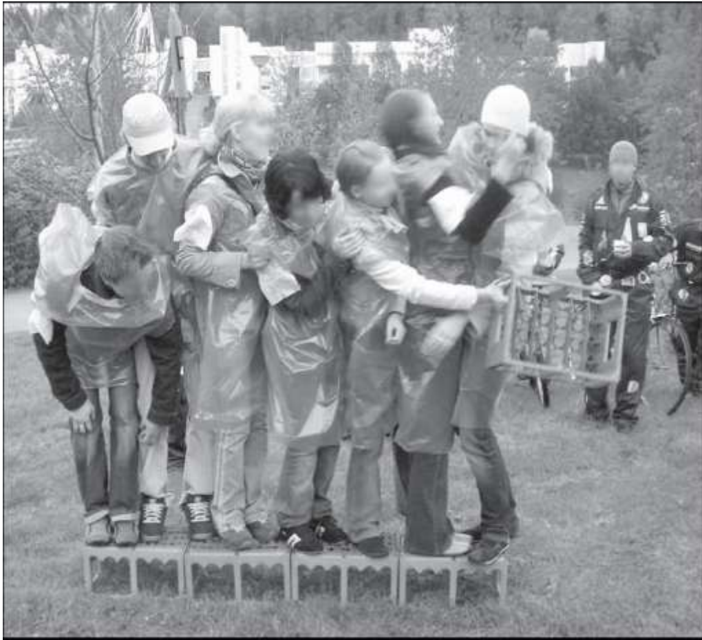
Kuva 2. Fuksit kilpailevat (#63, 26.)

nesteen salaisuuksista, s. 66). Näin ollen muki on tarpeellinen, koska heimo tarjoaa siihen yhteistä alkoholillista. Kenties tehtävän pullokorit ovat siksi tyhjiä?