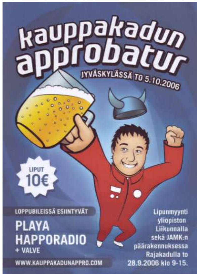
Kuva 3. Kauppakadun Appro (#27)

Kauppakadun Appro on vuotuinen opiskelijatapahtuma Jyväskylässä. Sen Internet-sivujen mukaan ”nämä opiskelijakarkelot antavat Sinulle mahdollisuuden tutustua parhaimpiin anniskeluravintoloihin ja solmia suhteita iloisein kanssaopiskelijoihin” (#27). Yhteisöllisyys on tapahtumassa vahvasti läsnä, ja sen perusteella on ymmärrettävää, miten Kauppakadun Appro on akateemisessa heimokulttuurissa niin suosittu perinteinen rituaali. Tapahtumaa mainostettiin kampusalueella julistein, joissa oli sama kuva (3) kuin verkkosivuilla.