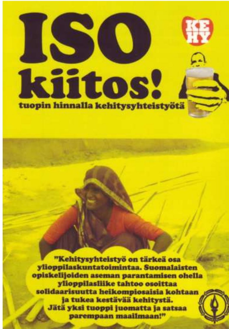
Kuva 1. KEHY-kortti (#28)

Kehitysyhteistyö on tärkeä osa ylioppilaskuntatoimintaa. Suomalaisten opiskelijoiden aseman parantamisen ohella ylioppilasliike tahtoo osoittaa solidaarisuutta heikompiosaisia kohtaan ja tukea kestäväää kehitystä. Jätä yksi tuoppi juomatta ja satsaa parempaan maailmaan! (ibid.)