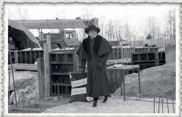
Ambiotican työmaalta peruskiven muurauksen aikaan