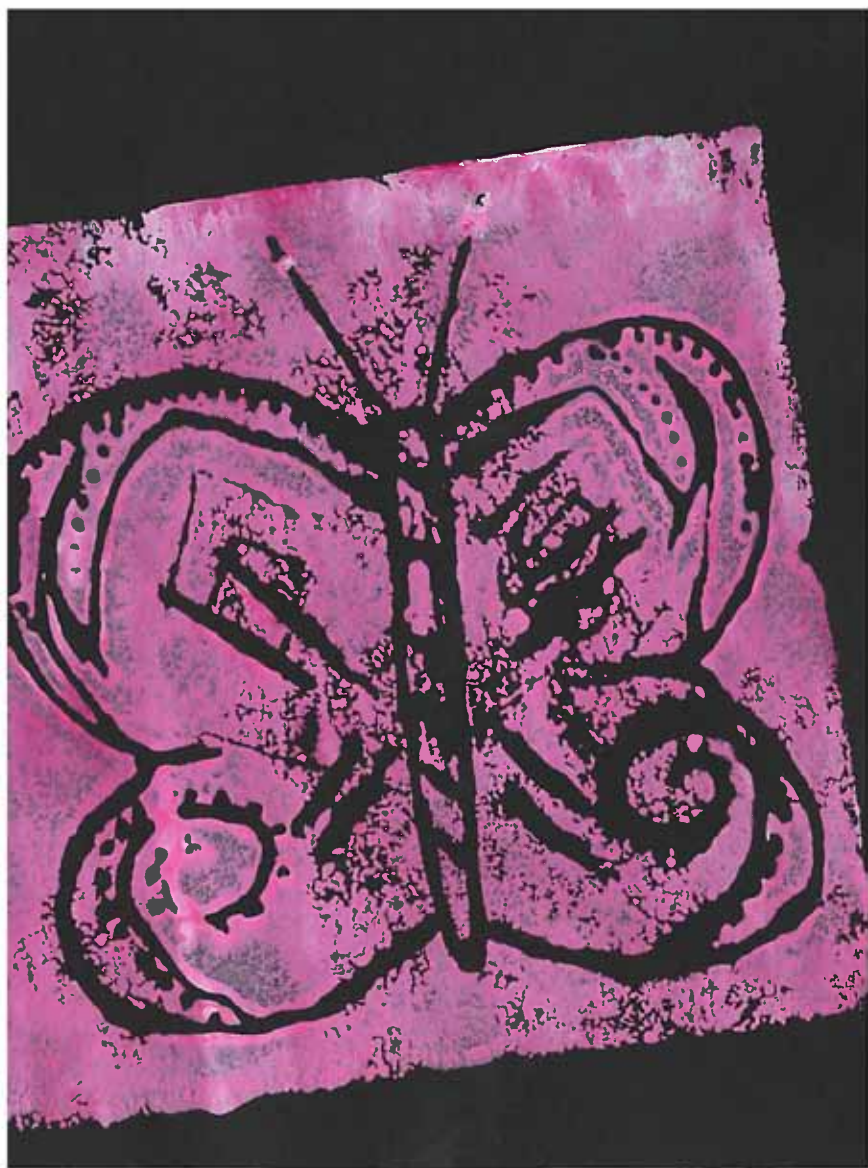
Grafikkatyön tekijä: Riikka Mervola 46 Tekniikka: Kohopainanta