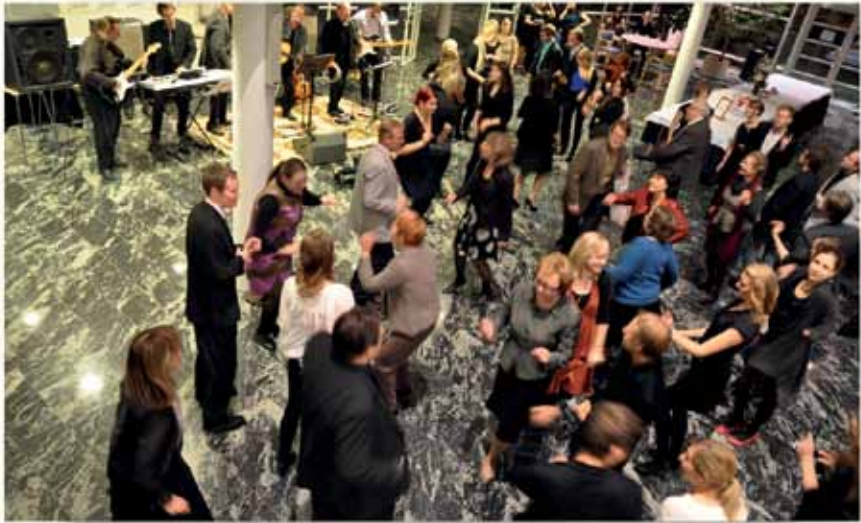
Rehtorin työ on sujunut kuin tanssi. Vauhdikas meno jatkuu!