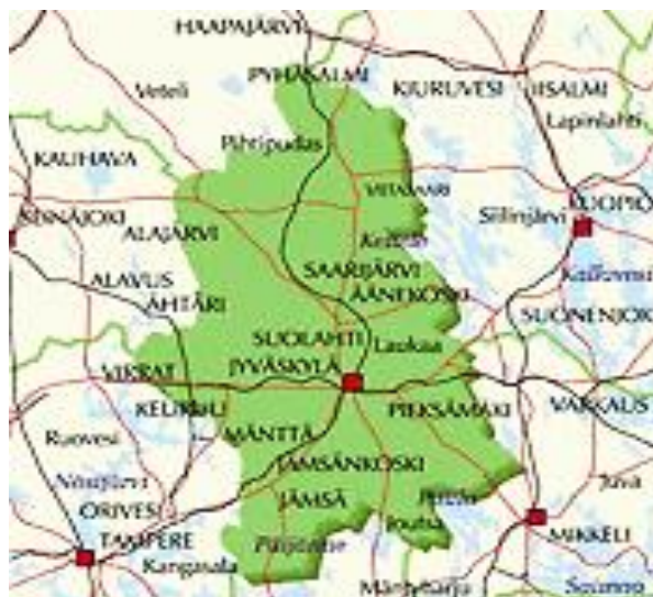
KUVA 2 Osuuskauppa Keski-Suomen liiketoiminta-alue.