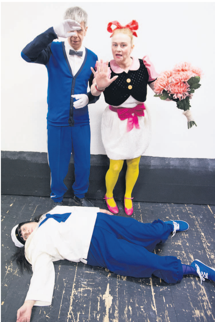
Viimeiseksi esitettävässä Tyhjyys -näytelmässä ollaan Ankkalinnan tunnelmissa. (Voittamattomien ensi-ilta oli 26. tammikuuta.)