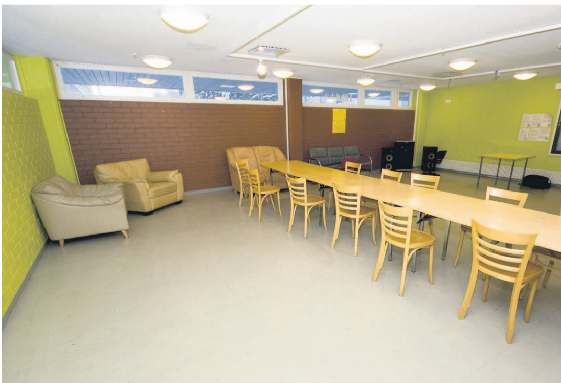
Lillukka on kodikas ja kaunistelematon. Porukkaa mahtuu tilaan mukavasti, ja vuokra on vaivaiset parikymppiä.

Vaikka Lillukka ei kenties ole se tyylikkään ja hohdokkain illanviettopaikka, se on todennäköisesti vuokrat-