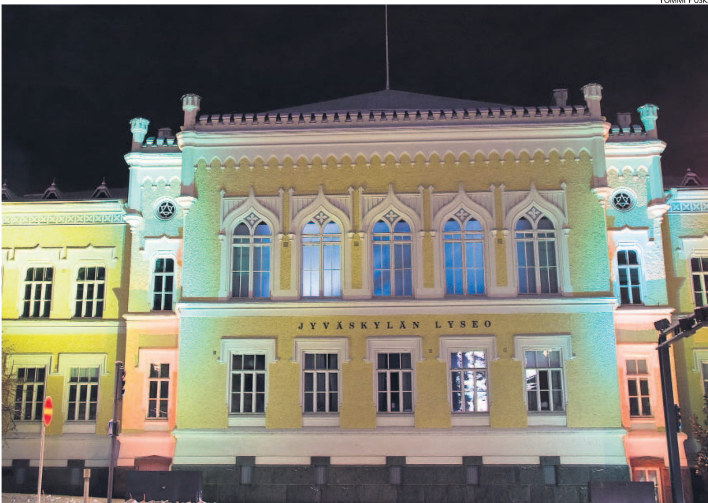
Valo leikkitteli Jyväskylän lyseon julkisivulla viime viikon keskiviikkona. Valotriologia-teosta esitetään pimeiden vuodenaikojen iltoina. Esitykset ovat keskiviikko-, perjantai- ja lauantai-iltaisin.