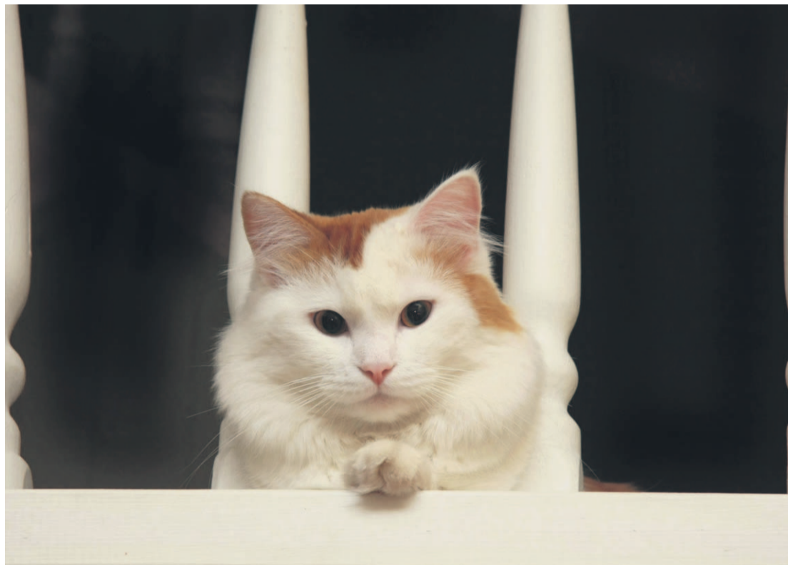
Be sure you can commit to looking after a pet for the next 10–20 years.