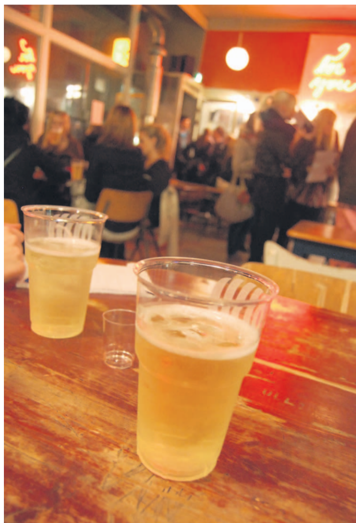
Juoru lämpimistä maltaista osoittautui ilkeämieliseksi.