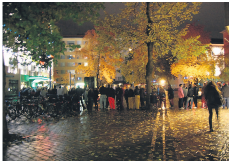
Kauppakadun Approon aikaan jonot olivat paikoin huimat.