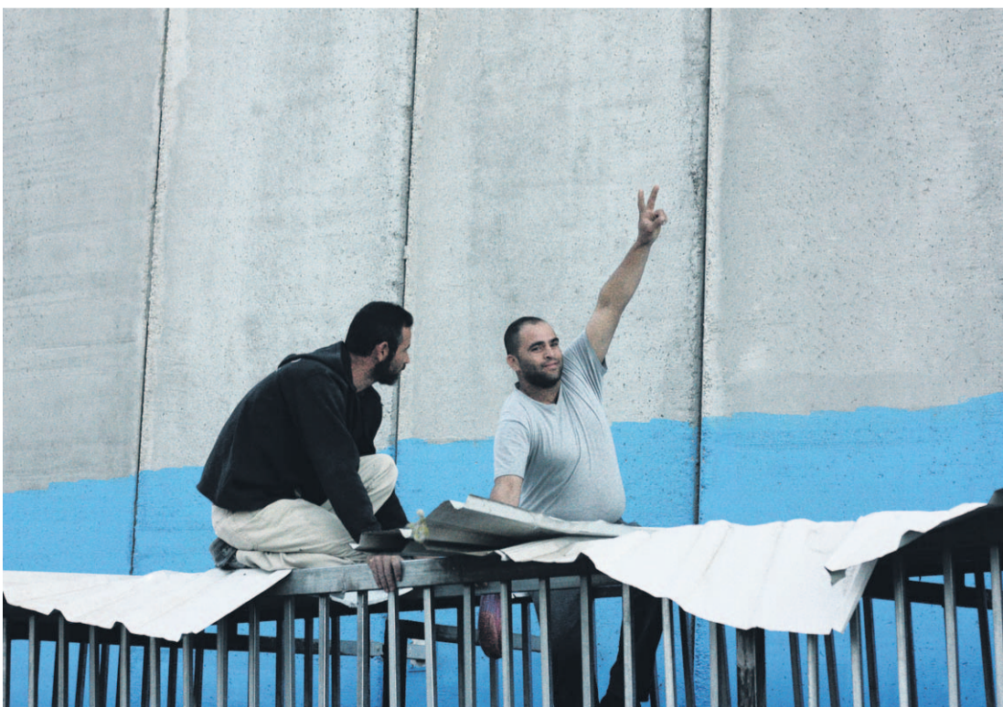
Monta kymmentä metriä pitkässä jonossa tunteet ovat usein pinnassa. Turhautuneet arabit alkavat usein ohitella toisiaan, ja rikotun häkin kautta jonon keskelle kipuaminen on yleistä.

ENNEN Hamasia opetin Al-Qudsin yliopistossa sähkötekniikkaa. Päätös lähteä mukaan puolueen toimintaan oli tietoinen. Fatah oli vielä todella