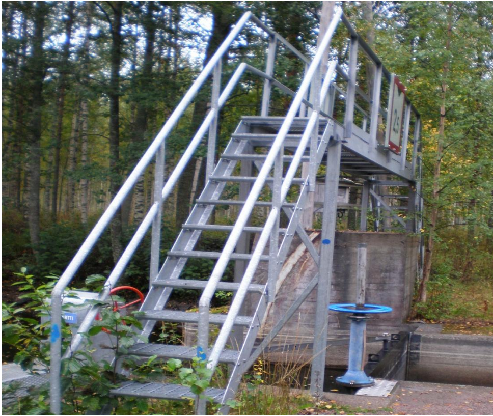
KUVA 11. Pyhäkosken pienvenesulku on rakennettu entiseen tukinuittouomaan.

kin ainutlaatuinen, historialtaan kiehtova ja matkailunkin kannalta mielenkiintoinen kohde reitillä.