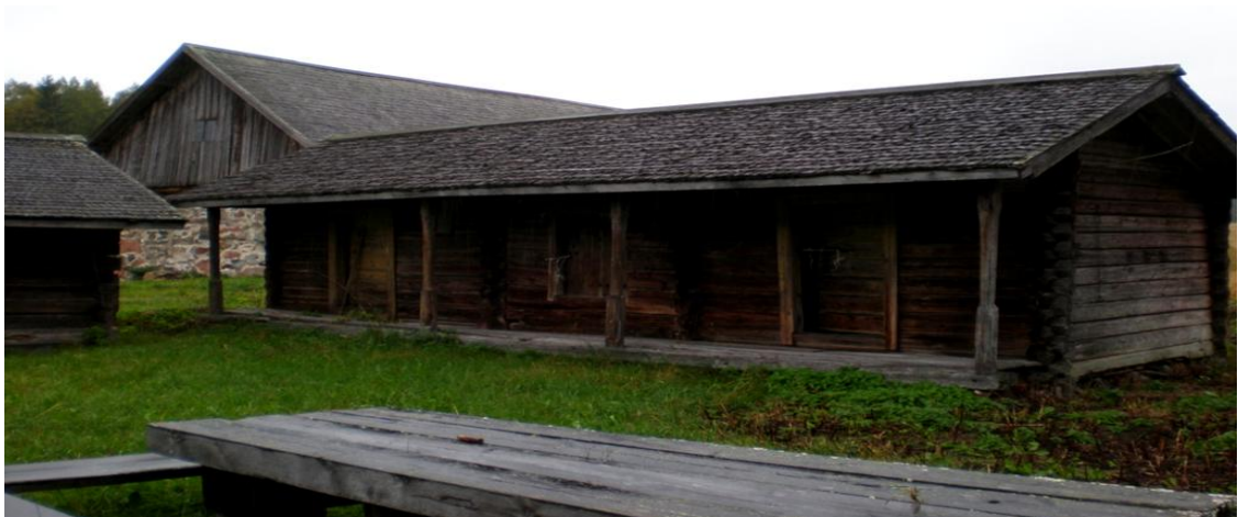
KUVA 12. Pyhäniemen perinnetilan ulkorakennuksia.