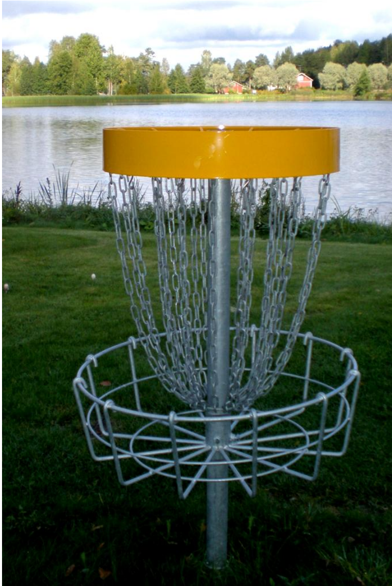
KUVA 25. Kurkiniemessä sijaitseva uudenkarhea frisbeegolf-rata valmistui vuonna 2010. Rata on rakennettu erityisesti nuorisoa ja matkailijoita huomioiden.

Mäntyharjulla ulkoilumahdollisuudet ovat hyvin saavutettavissa autoistumisesta huolimatta. Useimmat liikuntapaikat sijaitsevat asukaskyselyn mukaan kävelymatkan päässä kotoa. Autoistumista pidettiin 1970-luvulla myönteisenä kehityssuuntana, koska se lisäsi liikuntapaikkojen käyttöä väestökeskusten lähellä. Autoistumisen vaikutuksesta liikuntapaikkojen sijainti ei ollut sidottu yhtä paljon yleisiin liikuntayhteyksiin kuin ennen. Siksi liikuntapaikkoja oli mahdollista sijoittaa myös väestökeskusten ulkopuolelle. Samalla autoistuminen vaikutti viikonloppuina ja lomakausina käytettyihin liikuntapaikkoihin. Maasto-olosuhteet voitiin ottaa huomioon parhaalla mahdollisella tavalla. Tehokkuuden nimissä keskittiin suuriin yksiköihin. (Kokkonen 2010, 110–111.) Nykyaikaa leimaa sen si-