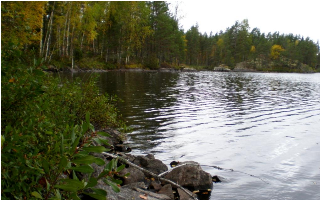
KUVA 20. Näkymä Siirlahdelle uudelta mahdolliselta yhdysreitiltä.

Uusi reitti on suunnitteilla kulkemaan Katiskalahdelta Siirlahden rantaa hyödyntäen. Rannalla on useita majavien kaatamia puita, joita voisi hyödyntää mahdollisesti pieniksi yksityiskohdiksi reitillä.