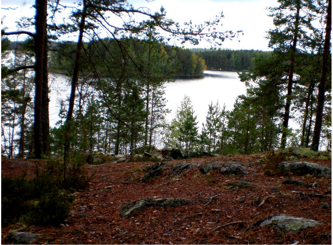
KUVA 2. Näkymä Teerniemeltä Pyhävedelle. Maisemallisesti mielenkiintoinen kohde Pappilanniemen reitillä on Teerniemen näköalapaikan lisäksi Nuotioniemen laavu. Molemmista paikoista aukeaa näkymä Pyhävedelle.