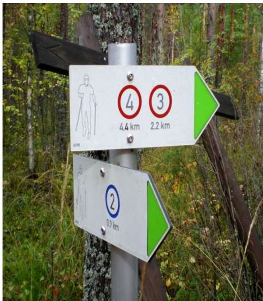
KUVA 5. Pappilanniemen sauvakävelypuiston merkintöjen ymmärtämisessä on ollut ongelmia.