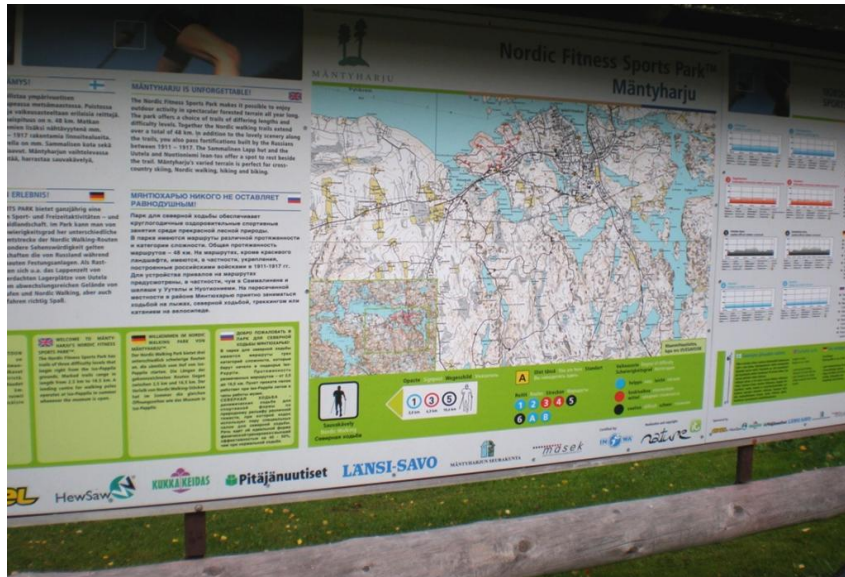
KUVA 4. Kattava opastaulu toivottaa ulkoilijan tervetulleeksi Pappilanniemelle. Selvitys ulkoilureitistä on laadittu suomen lisäksi englannin, saksan ja venäjän kielillä.