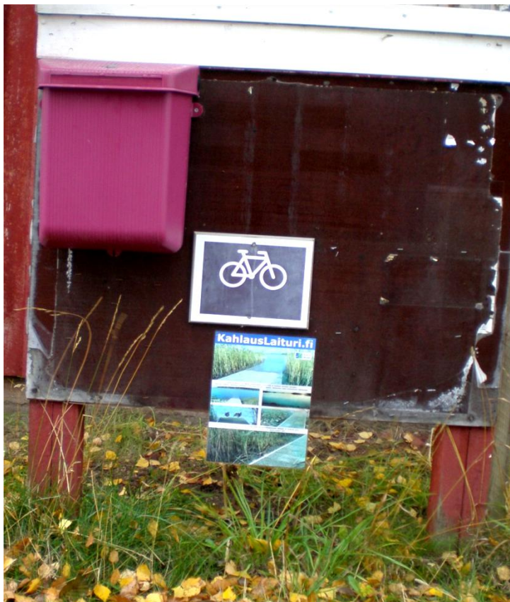
KUVA 15. Miekankosken pyöräilypostilaatikkoon käy kesän aikana nimensä raapustamassa usea pyöräilystä innostunut. Pyöräilijöiden kesken arvotaan arpapalkintoja.

Mäntyharjulla postilaatikkopyöräilyn ajankohta on vuosittain toukokuun alusta syyskuun alkuun. Postilaatikkopisteitä on 17. Miekankoski on kunnan suosituimpia postilaatikkopyöräilyn kohteita (Kuva 15). Se sijaitsee Miekasta Mäntyharjulle kulkevan maantien varrella. Uuden 419-tien rakentamisen myötä liikenne Miekasta Mäntyharjun keskustaan on vähentynyt parantamalla pyöräilijöiden turvallisuutta ja maantie on yksi kunnan suosituimmista pyöräilyreiteistä.