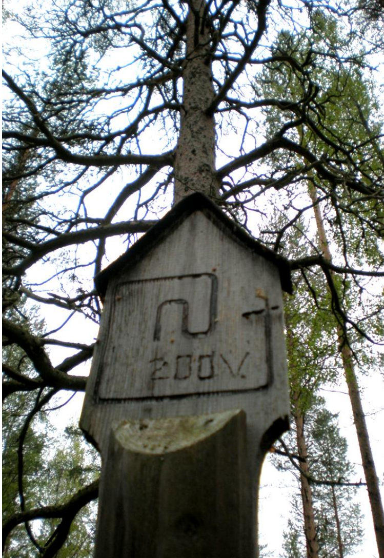
KUVA 9. Torpparinpolku on merkitty maastoon omalla kuviolla. Utelan torpan pihalla kasvaa 200-vuotias honka. Puu on nähnyt parinsadan vuoden aikana niin Utelan suvun torpparinvaiheet kuin raunioihin tutustuvat Torpparinpolun retkeilijätkin.