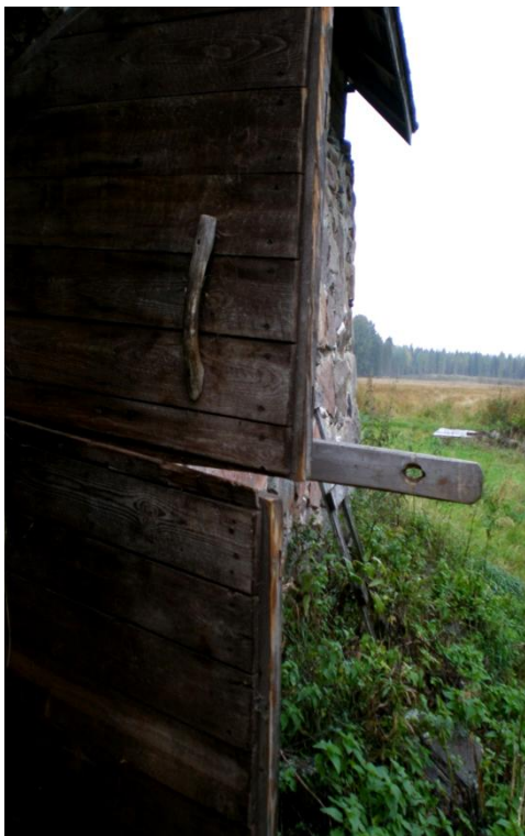
KUVA 14. Pyhäniemen kivinavetan ovensuusta aukeaa näkymä peltomaiseen.