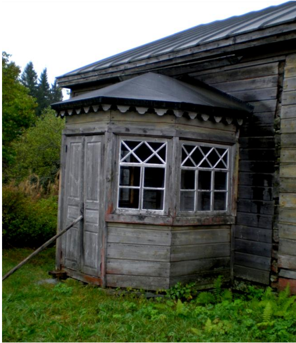
KUVA 13. Perinnetilan päärakennuksen näyttävä veranta on päässyt rapistumaan.