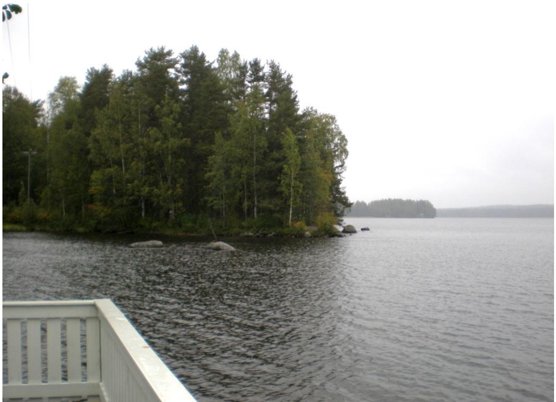
KUVA 24. Melontareitiltä voi rantautua Miekankoskelle vaikkapa kahville. Miekankoskella on myös kanoottivuokrausta.

Ensimmäisessä asiantuntijakokouksessa keskusteltiin Savonselän melontarengaan kunnostamista. Karttaan merkityt palvelut eivät enää pidä paikkaansa. Toisessa asiantuntijakokouksessa näkökulma melonnan kehittämiseksi kuitenkin hieman muuttui. Kokouksessa kävi ilmi, että melonnan harrastajat hakevat usein lyhyempiä reittejä.