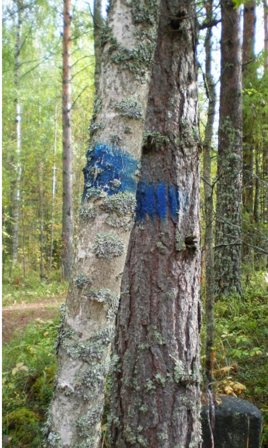
KUVA 6. Puihin maalatut siniset merkit ohjaavat ulkoilijan Pappilanniemellä oikeille reiteille useiden polkujen verkostossa. Viittojen kunnostus on vielä kesken.

Mouhun ulkoilureitti lähtee Kisalasta, Mäntyharjun taajamasta, ja jatkuu Mouhun kylään Valkealan rajalle. Reitti kulkee metsämaastossa polku- ja metsäreittinä sekä maantiellä. Reitin varrella on useita metsäjärviä ja lampia. Mouhulta reitti jatkuu Repoveden kansallispuistoon. Mouhun reitti on 22 kilometriä pitkä ja se kulkee niin yksityisten kuin seurakunnankin mailla. Mäntyharju–Mouhu -reitti on tärkeä yhteys Repoveden kansallispuiston suuntaan. Koska reitti kulkee Repovedelle myös Kouvolan alueella, sen kehittäminen myös naapurikunnan alueella on tärkeää. Repovedelle kulkevan reitin varrella tulisi vähentää maanteitä pitkin kulkemista. Mouhun ulkoilureitin varrella on useita historiallisia kohteita, kuten punasotilaan 1950-luvulla löydetty hauta sekä sisällissodan aikaisten Mouhun taisteluiden muistomerkki.