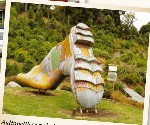
Aaltopellistä valmistettu kumisaapas on Taihopen tunnettu maamerkki.

Mielenkiintoista oli päästä näkemään välähdys markkinaliberalistisesta maaseutuelämästä. Pakon edessä maataloustuottajat ja muut yrittäjät ryhtyivät aikoinaan kehittämään alueen elinkeinoelämää yhteisrintamassa. Vaikka kehityksessä on ollut havaittavissa menestyksen tunnusmerkkinä pidettyä dynaamista luovaa tuhoa, ihmiset näyttävät silti sopeutuneen muutok-