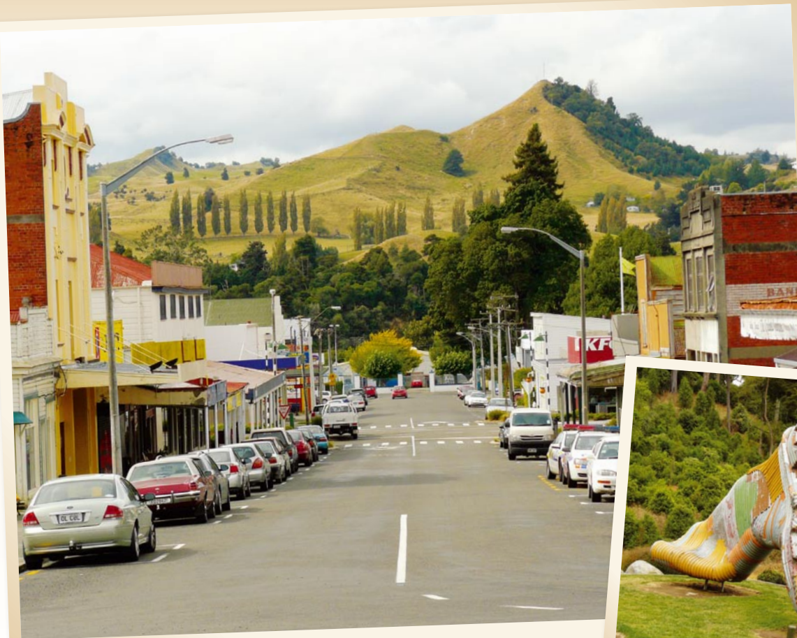
Näkymä Taihopen rautatieasemalta.