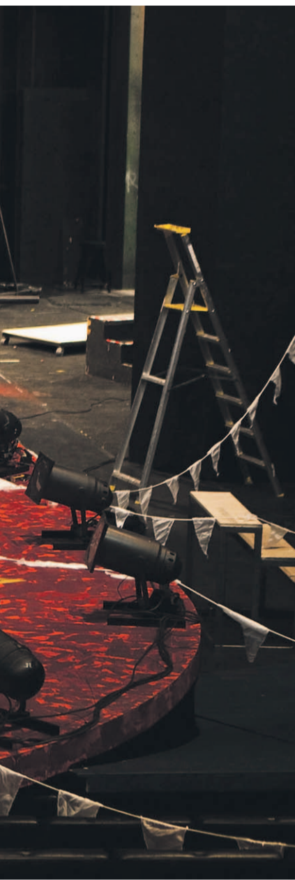
töksen jälkeen, minkä vuoksi näyttä-