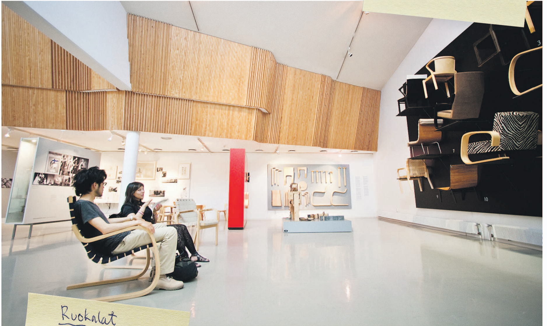
Mattilanniemen ja Seminaarinmäen välillä Äylässä sijaitsevassa Alvar Aalto -museossa on muun muassa noin 1 600 esineen kokoelma, johon kuuluu esimerkiksi Aallon suunnittelema huonekaluja, valaisimia, lasiesineitä ja maalauksia.

Museot - Alvar Aalto -museo - Keski-Suomen museo - Käsityö museo - Taidemuseo