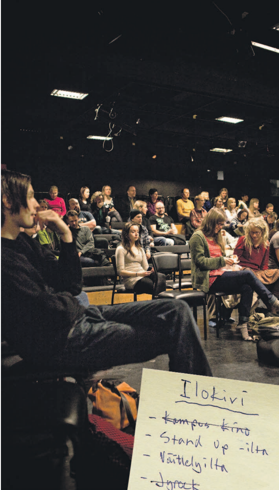
Joka tiistai Ilokiven alakerran mustassa laatikossa esitetään Kampus Kinon elokuvia.