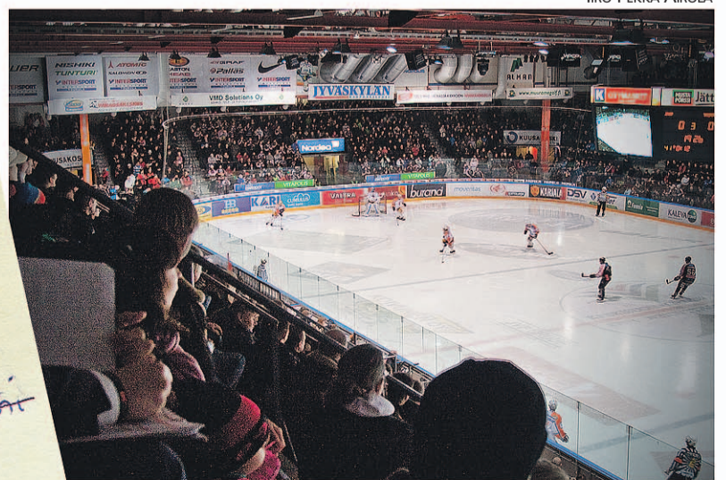
Jyväskylässä on paljon pääsarjajoukkueita. Niistä näkyvin on Hippoksen jäähallissa kotiottelunsa pelaava JYP, joka johtaa jääkiekon SM-liigaa.