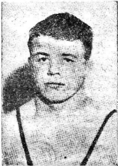
GLANS. Voittamaton vielä. Saako Mäki tänään koston?

Muuten ei juoksuvalmennuksakaan erikoistuminen saisi olla, mitä harjoitusmatkoihin tulee, niin ahdasta kuin yleensä pidetään tapana. Tärkeissä kilpailuissa täytyy useimpien tyytyä yhteen tai pariin matkaan, mutta monellekin saattaa olla sekä ruumista vartuttavaa että hermoja virkistävää juosta kilpailuisekin outoja matkoja. Puhumattakaan nyt siitä, että kilpailukauden tai parinkin "vierailunäytöntö" (Jatk. 6:lle siv.).