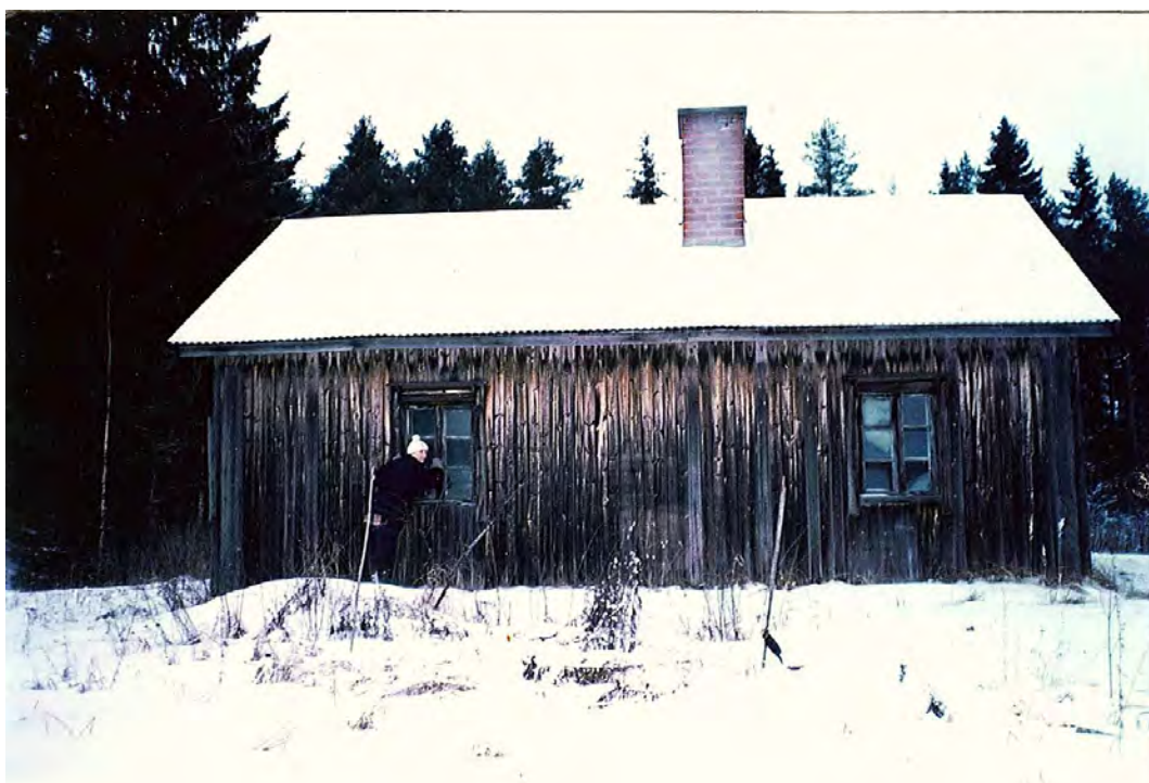
KUVA 23 Pala puista menneisyyttä. Kuva: Taina Jauhiainen, 1990-luvun loppu.

Haastattelumatkojeni yhteydessä olen saanut tutustua museoihin; useimmiten omistajat halusivat itse esitellä museonsa minulle. Esittelyjen avulla keräsin omakohtaisia havaintoja esineistä ja niiden muodostamista kokoelmista, kun aineistoni muutoin painottuu museoijien tekemiin tulkintoihin esineistä, museoista ja museoimistyöstä. Sekä välitön että myöhemmin, pitkän ajan kuluttua mieleen painunut kuvani kokoelmista korostaa esineiden materiaalia. Kokoelmat ovat täynnä puuesineitä, ja museot sijaitsevat vanhoissa puisissa rakennuksissa. Mielikuvaa vahvistavat kenttätyömatkoilta ottamani valokuvat.