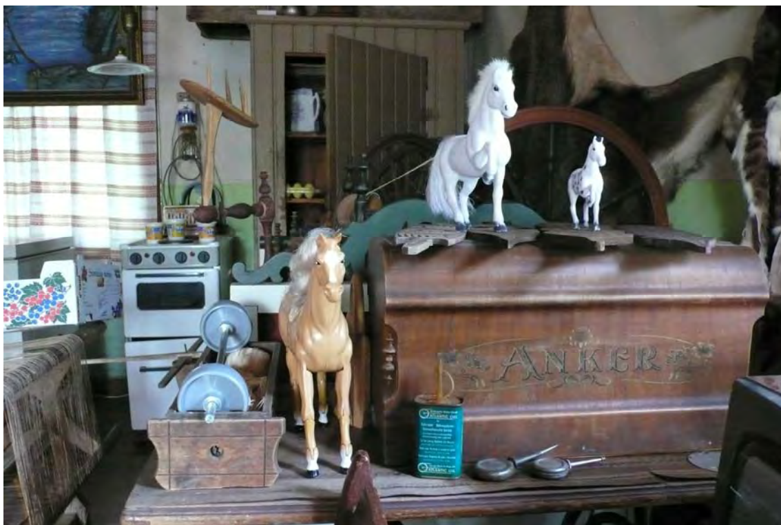
KUVA 12 Erikoinen esimerkki uudehkojen ja vanhojen esineiden yhteiselosta yksityisessä museossa. Kuva, varsinkin kun sen rinnastaa vastaavanlaisissa yksityisissä museoissa otettuihin valokuviiin, herättää kysymyksen muovihevosten merkityksestä omistajalle.

Haastattelujen ja kirjeiden kautta avautuvat yksityisiin museoihin tallennetut kuvat menneisyydestä ovat samankaltaisia. Haastattelemistani museonomistajistakin valtaosa oli perustanut museonsa koti- tai sukutilalta löytyneiden esineiden säilymiseksi seuraaville sukupolville. Mukaan on saattanut joutua muutamia naapureiden tai tuttavien museoon lahjoittamia esineitä, ja muutama museoija on perustanut museonsa tyystin muualta hankkimiansa esineiden varaan. Kokoelmia tarkastelemalla museoita ei kuitenkaan voi erottaa toisistaan, vaan niiden sisällöt ovat samankaltaisia. Herää kysymys siitä olisiko jossain olemassa museon ideaalimalli, jota kaikki aineistoni yksityiset museot tavalla tai toisella toistavat, vai olenko luonut ideaalimallin aineistoa tulkitessani.