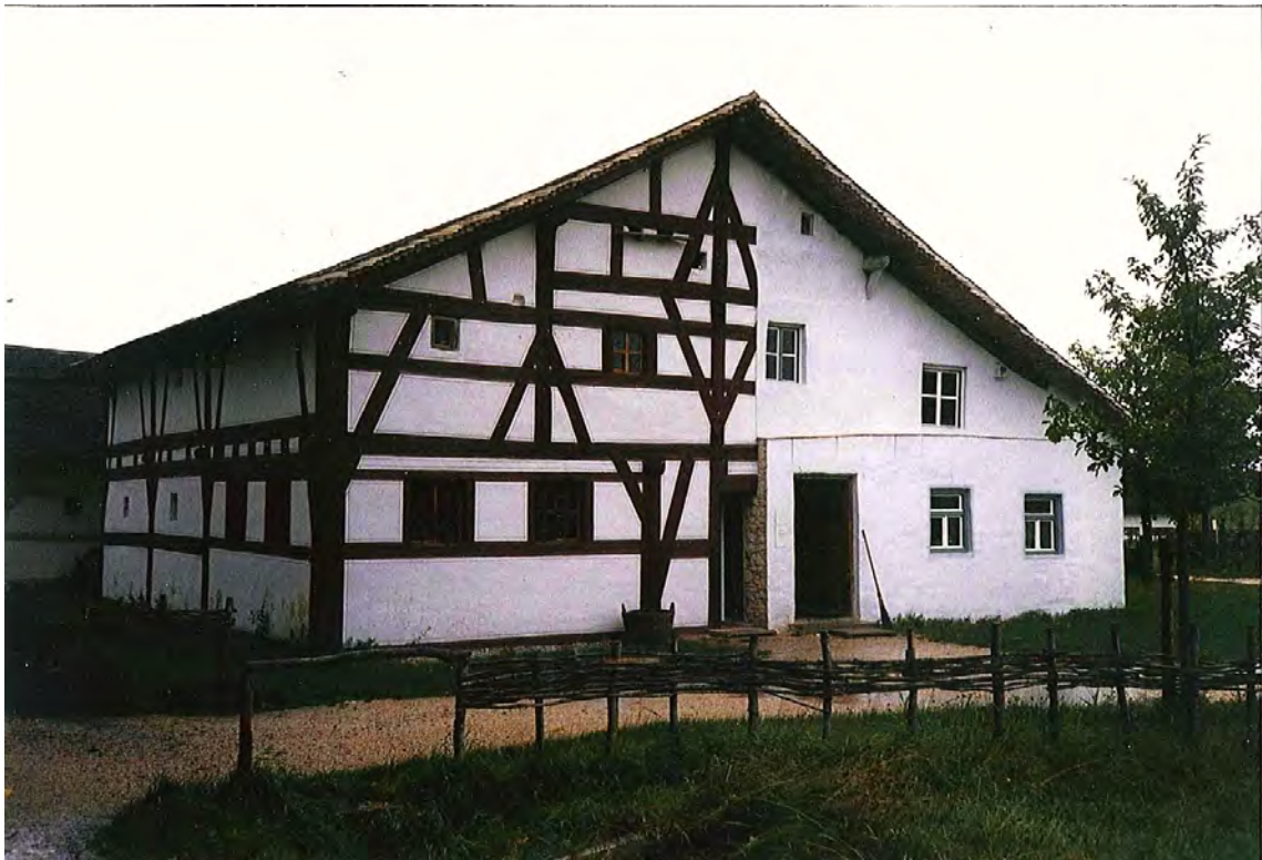
KUVA 26 Esimerkki muunnellusta esineestä, josta puolet on palautettu alkuperäiseen asuunsa. Kuvan rakennus sijaitsee Bad Windsheimissa Fränkisches Freilandmuseum alueella, ja se on ennallistettu osittain museon toimesta. Myös rakennuksen sisäosat on palautettu puoliksi alkuperäiseen asuunsa, ja toinen puoli jätetty sellaiseksi kuin mitä se oli 1950-luvulla, jolloin rakennuksen asumiskäyttö loppui. "Muuntelu" saattaa siis viitata esineiden normaaliin käyttöön ja vuosien kuluessa esineelle tapahtuneisiin muutoksiin. Kuva: Elina Kiuru, 1998 tai 1999.

Pariskunta kokee tärkeäksi pelastaa kaatopaikalle joutuvia tai jo joutuneita esineitä samoin kuin heidän omaan menneisyyteensä liittyviä, muiden sukulaisten romuiksi määrittelemiä tavaroita. Heille menneisyys on tärkeää, heillä on esineille tilaa. Menneisyys määrittyy heidän puheessaan alkuperäisyydeksi. Mitä he alkuperäisyydellä muuntelemattomuuden lisäksi sitten tarkoittavat? Haastattelussa museon omistajapariskunta kiinnittää huomioni heti aluksi kahteen eri seikkaan: