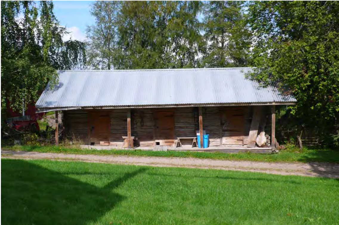
KUVA 1 Suuri osa yksityisistä museoista sijaitsee maaseudulla. Kuvassa suomalaisen maatalon pihapiirissä sijaitseva aittarivi, johon on sijoitettu museoituja esineitä. Rakennuksen katto on katettu pellillä, jotta sisällä olevat esineet säilyisivät mahdollisimman hyvin.

Tutkimusaiheeni on syntynyt huomioista, jotka kohdentuvat menneen esillä pitämiseen ympäröivässä kulttuurissa sen eri tasoilla ja eri toimijoiden taholta. Tutkimukseni fokus on museon käsite sen aineellisen kulttuurin kenttään sijoittuvan erityislaatuisuuden vuoksi: käsitteessä kulminoituvat modernin ihmisen kaipuu menneeseen, luokittelun tarve sekä keräily ja museoiminen yksilöllisenä ja yhteisöllisenä elämänhallinnan prosessina. Näitä kaikkia näkökulmia tarkastelen työssäni. Tutkimuskysymykseni ovat seuraavat: