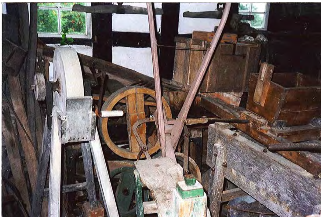
KUVA 24 Puisia esineitä yksityisen museon kokoelmassa.