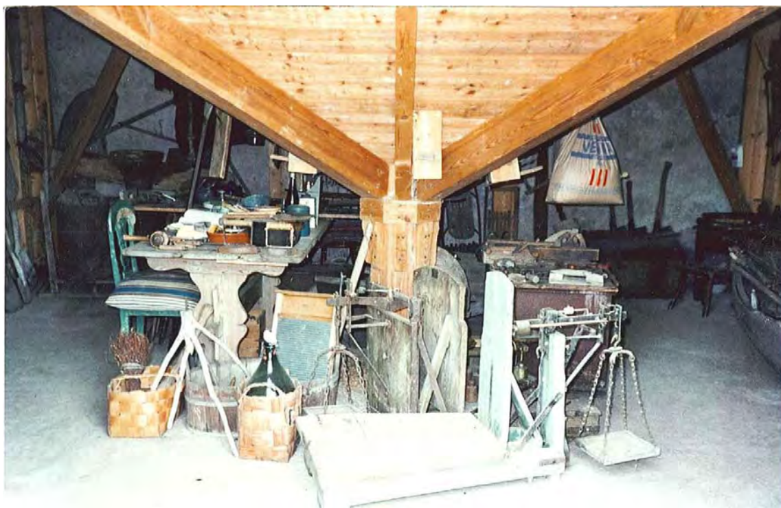
KUVA 27 Käyttöfunktioltaan hyödyttömiä esineitä museokokoelmassa.