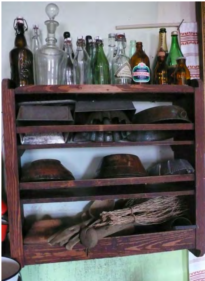
KUVA 2 Vanhoja esineitä yksityisessä museossa niitä varten järjestetyssä paikassa. Kuvan hylly on osa omistajan kodin sisustusta, mutta erottaa kuitenkin museoesineet käyttöesineistä. Voi ajatella, että vanhoilla, museoiduilla esineillä on kodissa myös sisustuksellinen ulottuvuutensa.

jollain keinolla. Baudrillardin ajattelussa vanhat esineet toimivat ehdottoman ja tiedostetun olemassaolon vaatimuksen täyttäjinä kantaessaan olemuksessaan ajan merkkejä (ks. Baudrillard 1997, 74–75). Samalla ne ovat osa nostalgisen kunnioittavaa suhtautumista menneisyyteen 20 .