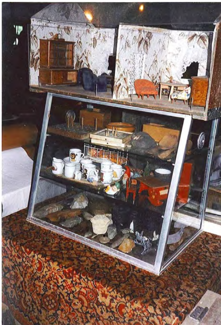
KUVA 5 Luonto ja kulttuuri samassa yksityisen museon vitriinissä. Ylä- ja alahyllyillä luonnonesineitä, keskellä ja vitriinin päällä miniatyyriartefakteja. Vitriinin olemus muistuttaa kuriositeetikabinettia pienoiskoossa.

2005, 45). Museon prototyypiksi nimetään museologisissa teksteissä usein 1500-luvun firenzeläinen maailmankabinetti, jossa pyrittiin esittämään esineiden avulla systemaattisesti koko maailman järjestys (Aurasmaa 2002, 94; Hooper-Greenhill 1992, 105–106). Mahdollisuus tutustua museoiden kokoelmiin tarjosi mahdollisuuden jäsentää visuaalisesti tieteen maailmankuvaa 29 .