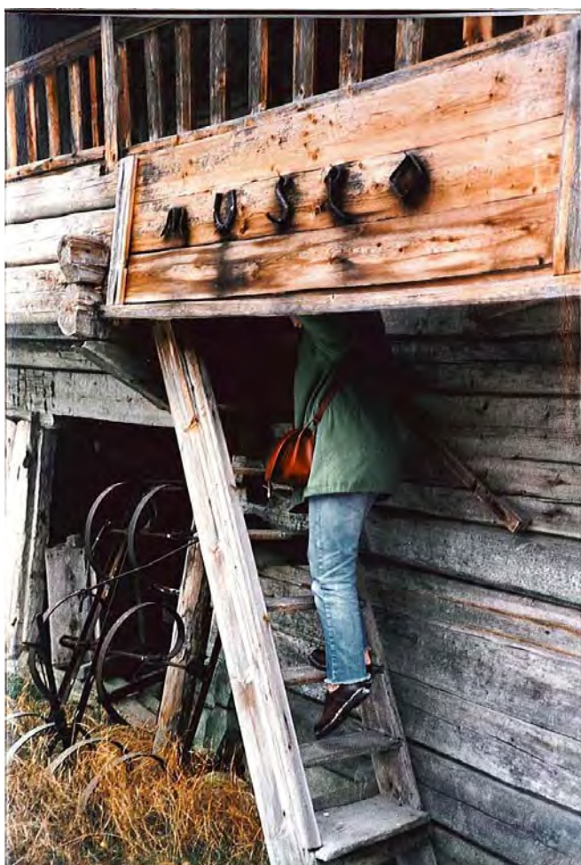
KUVA 8 Esimerkki yksityisestä museotoiminnasta: museo omistajan omalla kotitilalla. Kuva: Eeva Uusitalo, 1998.

organisaatio Museovirasto käsittelee uusimmassa julkaisemassaan tilastossa 157 ammatillisesti hoidetun museon asemaa julkisuus-yksityisyysasteikolla museoiden omistajuuden mukaan siten, että kaikista tilastoiduista museoista 60 eli 38 % oli yksityisiä. Yksityisellä omistajuudella tarkoitetaan tilastossa säätiöiden ja yhdistysten ylläpitämiä museoita, jotka lain mukaan voivat saada toimintansa rahoittamiseen valtionosuutta. (Museotilasto 2009 [online].) Yksityisyys tarkoittaa tässä kohden juridista, omistajuuteen liittyvää yksityisyyttä eikä ota kantaa omistajan harjoittaman toiminnan yksityisyyteen tai yhteisöllisyyteen. Oma lähtökohtani yksityisen ja julkisen käsitteissä on laajempi kuin Museotilastoissa esitetty. Selvitän työssäni museoiden yksityisyyttä ja julkisuutta niiden omistajuuden, talouden, toiminnan sekä saavutettavuuden näkökulmista.