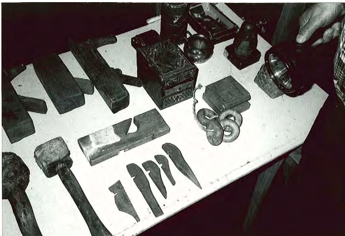
KUVA 13 "Miesten töihin" viittaavia esineitä entisen metsätorpan museokokoelmassa.

Luultavasti miehinen painotus on osittain haastattelutilanteeseen liittyvä, kokemuksellinen vivahde. Museon omistajan sukupuoli korostaa sitä, samoin hänen omat mielenkiintonsa kohteet museossa. Mikäli museota olisi esitellyt joku toinen, painotus olisi voinut olla erilainen, ja koko museosta olisi syntynyt toisenlainen mielikuva. Valokuvuihin on tallentunut "miesten töiden" lisäksi tekstiilejä ja muuta omistajan itsensä "naisten töihin" liittyvää.