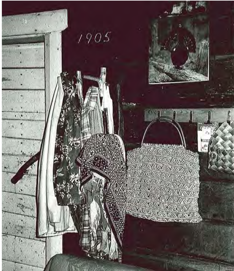
KUVA 14 Torpparimuseon "naisellinen" puoli?

Paikalla on ollut samankaltaisia mökkejä aiemminkin, ja yhteensä tilalta on purettu kymmenkunta rakennusta uusien tieltä. Kaikkein alkuperäisimmistä eli vanhimmaksi tiedetystä rakennuksesta – savutorpasta 1700-luvulta – on jäljellä enää ovi. Ulkorakennuksissa on metsätyökalujen lisäksi kalastukseen, metsästykseseen, maatalouteen sekä muihin ulkotöihin liittyviä esineitä.