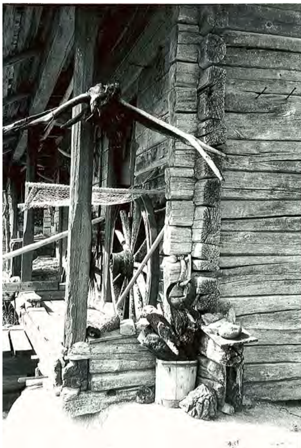
KUVA 19 Yksityisen museon aittarivistö osana kulttuurimaisemaa. Missä kulkee yksilöllisen omistuksen ja yhteisöllisen kulttuuriperinnön välinen raja? Kuva: Elina Kiuru, 1997.

putuloksen kannalta? Aineellisen kulttuuriperinnön vaalimiseen liittyvän valtakeskustelun sijaan keskityn tuomaan esille erilaisia tapoja jäsentää perinnön ja perimän merkitystä.