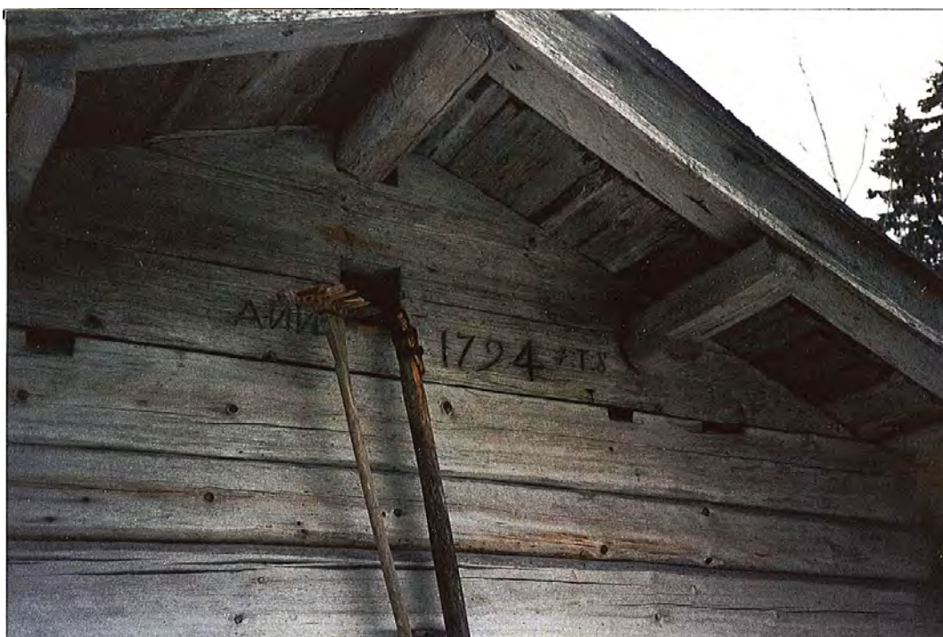
KUVA 11 Yksityisen yleismuseon omistajan minulle osoittama vuosiluku piharakennuksen seinässä. Huomion kiinnittäminen erityisesti vuosilukuun kertoo sen merkityksestä omistajalle.