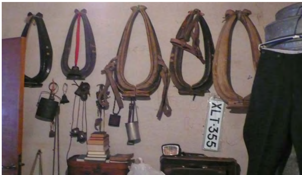
KUVA 18 Yksityisen museon esineitä esillä. Järjestyksessä on viitteitä niin samankaltaisuudesta (länget) kuin käyttöyhteydestäkin: ratsastushousut, länget ja auton rekisterikilpi viittaavat kaikki liikkumiseen paikasta toiseen. Kuva: Saara Laukkanen, 2007.

asettelun saattaa tunnistaa esineiden määrästä: kuparisia kahvipannuja saattaa kokoelmassa olla vierekkäin kymmenenkin 45 .