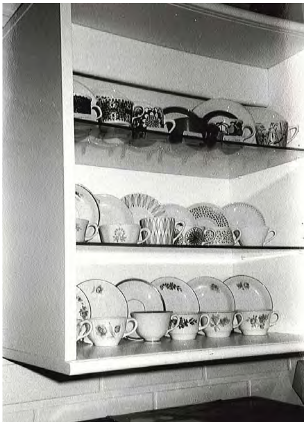
KUVA 4 Kahvikuppikokoelma, joka voi viitata joko oman elämän muistoihin (matkamuis-tokeräily) tai antikvaarin keräilijän pyrkimykseen herättää henkiin suomalaisen kahvikup-pin "historia". Kuva: Elina Kiuru, 1995.

Esineiden fyysinen olemassaolo antaa ymmärtää, että menneisyys on läsnä. Kaipuu menneeseen ei kuitenkaan täyty, koska perille ei voi päästä: