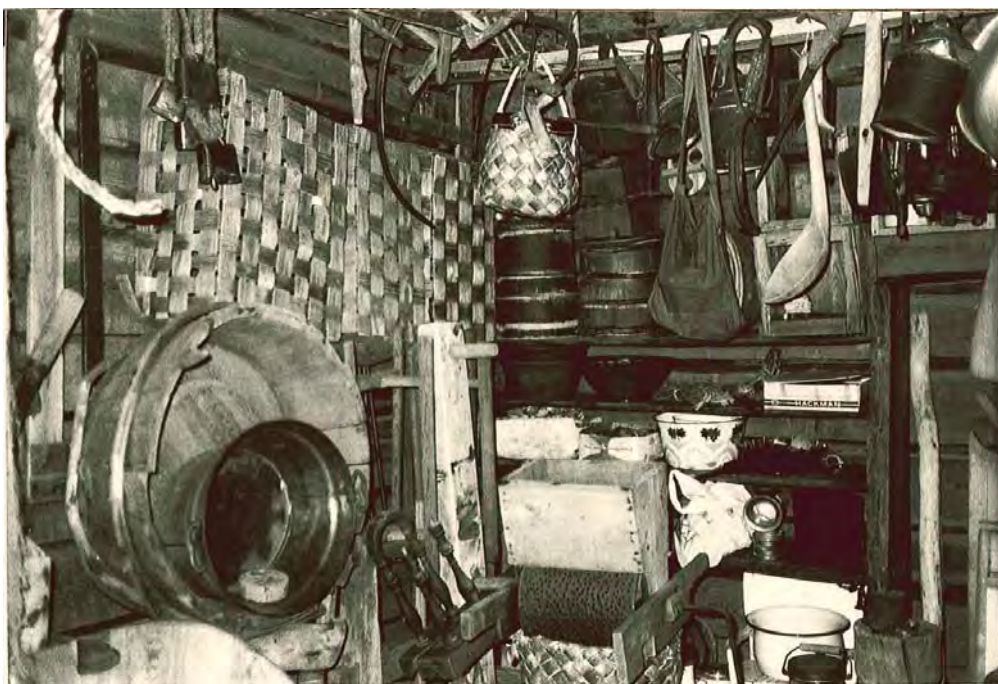
KUVA 10 Vanhoja, käytöstä poistettuja esineitä yksityisessä, maatalon ulkorakennuksessa sijaitsevassa museossa.

X.X. (omistajan isä, ES) tallenteli vanhaa ja alkoi keräillä aittaan 1950 luvulla. (Kirje, 8.11.1997.)