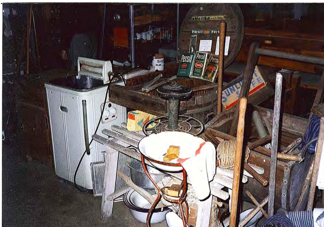
KUVA 25 Vaatteiden pesemiseen liittyviä esineitä eri ajoilta. Puinen pesukaukalo tms. samoin kuin pyykkilauta viittaavat aikaan ennen pulsaattorikonetta ja pesuainepaketteja, samoin pesuvadit penkin alla. Kuvaan on sijoitettu myös vartalonhoitoon liittyvä pesuvatteline.

Esimerkiksi kronologisen ja typologisen jäsennyksen esiintymisestä museokoelmassa sopii myös satunnainen valokuva saksalaisesta yksityisestä, vaikkakin tyypiltään yleismuseosta: