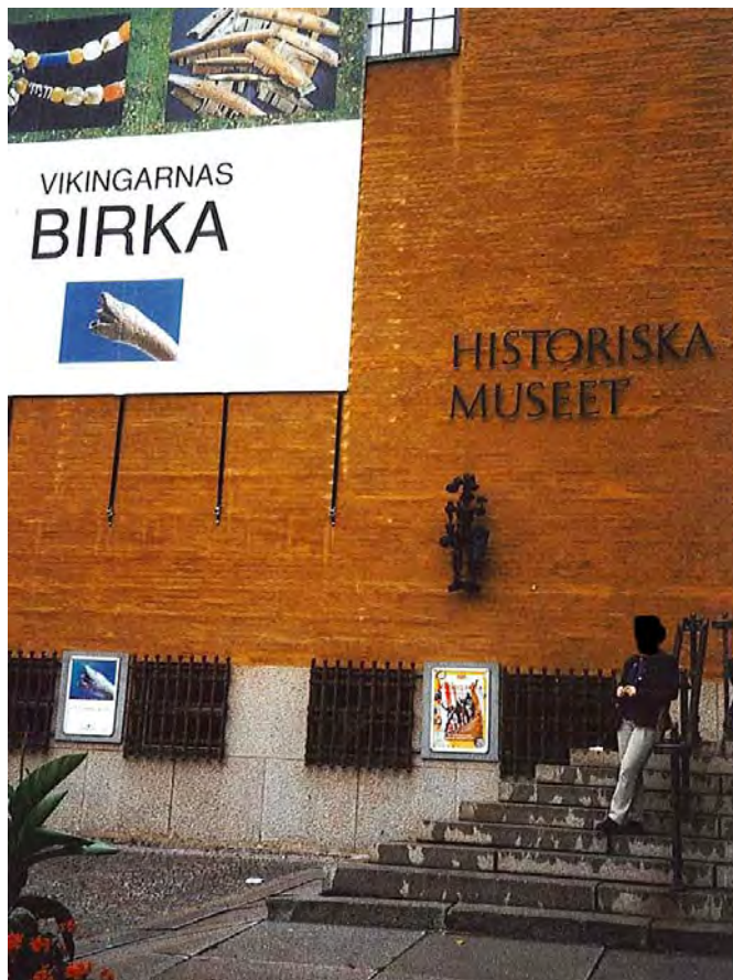
KUVA 7 Historiska museet Tukholmassa on osa ruotsalaista museoinstituutiota samalla tavoin kuin esimerkiksi Museoviraston alainen Kansallismuseo Suomessa.

Museolaitos on kansallinen instituutio yhdessä koululaitoksen, yliopiston sekä jo mainittujen arkisto- ja kirjastolaitosten kanssa. Instituutiona se on osa kansalaisyhteiskuntaa, ja sillä on yhteiskuntavelvoitteenaan palvella kansalaisia tarjoamalla heille huvia ja hyötyä. Sen tehtävät erottavat sen muista instituutioista. (ks. Eriksen 2009, 13–14.)