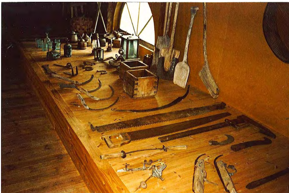
KUVA 22 Työnteon välineitä yksityisten museoiden kokoelmista Itä-Hämeen museon kesänäyttelyssä. Kuva: Elina Kiuru, 1990-luvun loppu.

aikaan. Ei tarvinnut erikseen keksiä, miten saisi tarpeeksi liikuntaa tai mitä teki si vapaa-ajalla, ja elämän rytmi oli yksinkertainen.