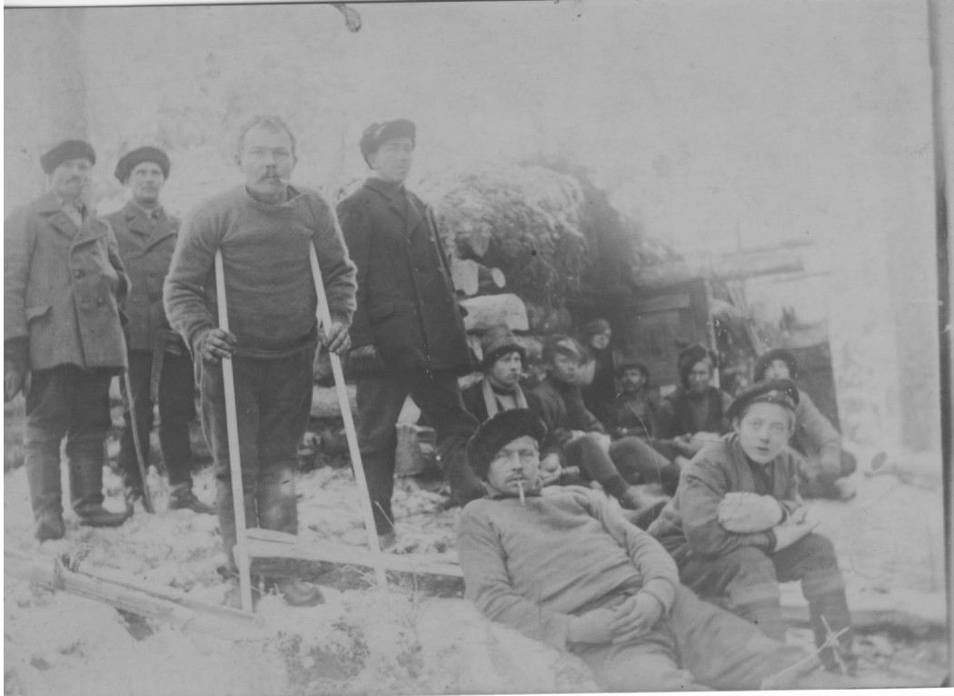
Savottalaisia metsäsaunan edustalla 1920-luvulla.