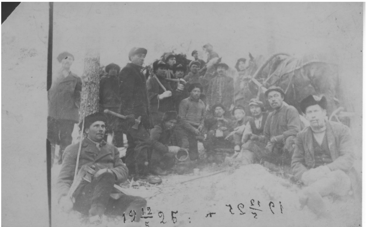
Talvisavottalaisia vuonna 1925.

Litteroinnin tein savon murteella siten kuin olin tekstin nauhalta kuulevinani. Haastateltavat puhuivat samaa murretta kuin minä, joskin he käyttivät joitakin ilmaisuja, jotka ovat jo itseni ikäpolvelta kadonneet. Joitakin sanoja katsoin tarpeelliseksi selittää sulkumerkkien sisässä kirjakielellä. Tosin minulla oli itse murretta taitavana vaikeuksia arvioida, kuinka vaikeaa luettavaa sitaatit ovat toispaikkakuntalaisille – olisiko selityksiä ehkä kaivannut enemmänkin? Savottatermejä en katsonut enää mielekkääksi selittää tämän tutkimuksen yhteydessä, koska aiheesta on ilmestynyt lukuisia, helposti saatavilla olevia teoksia. Sitaateissa piste tarkoittaa puheen selvää taukoa, pilkku lyhyempää hengähdystä. En siis käyttänyt välimerkkejä oikeinkirjoitustavan mukaisesti, vaan kertomaan kerronnan rytmistä. Muutenkaan en sitaateissa pyrkinyt oikeinkirjoitustavan mukaiseen ilmaisuun, vaan esimerkiksi haastateltavieni kerrontaan sisältyviä sitaatteja ei ole erotettu sitaattimerkeillä, vaan kerronta etenee omassa rytmissään.