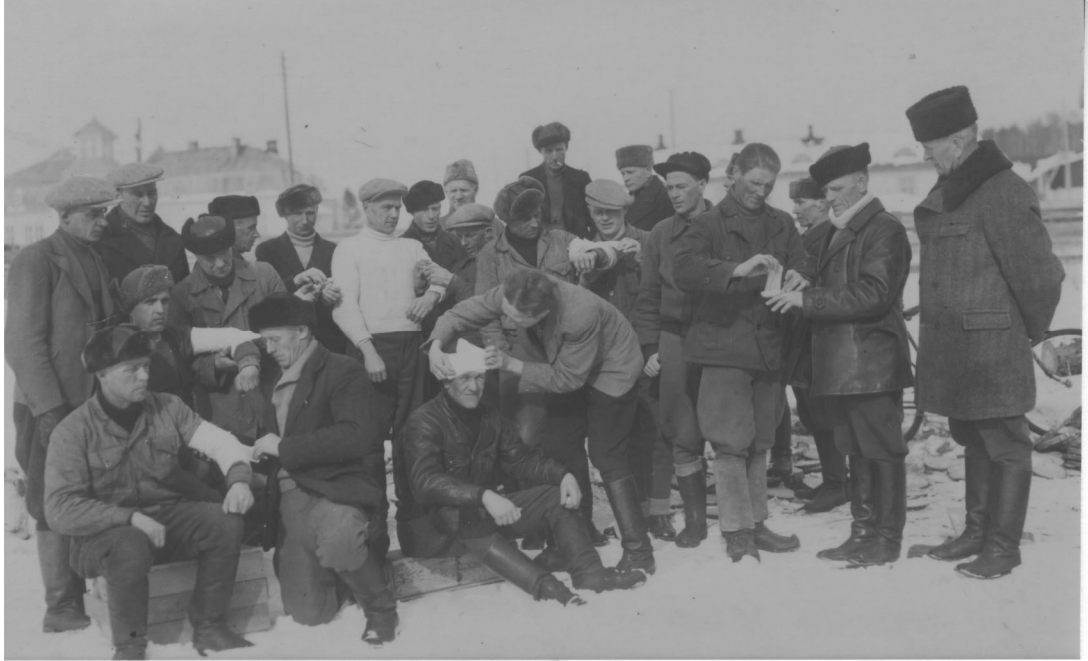
Ensiapukurssi savottalaisille lisalmessa vuonna 1943.