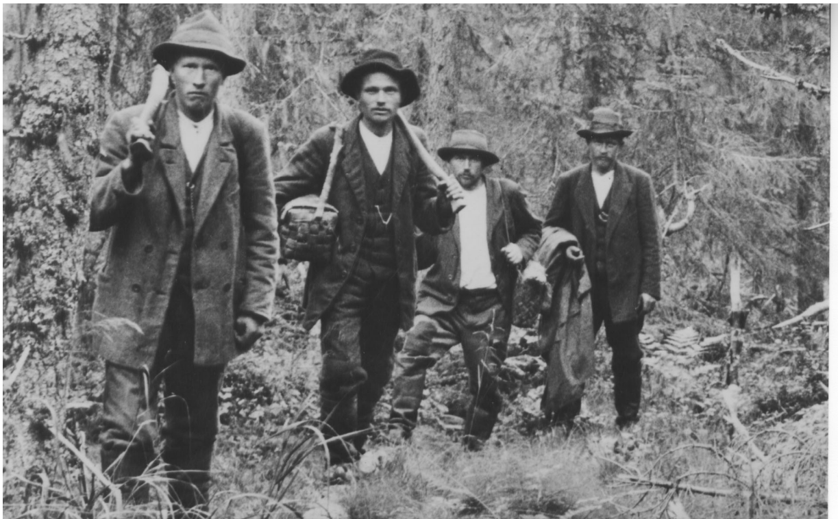
Linjanvetoon lähtö Sonkajärven Jyrkällä 1920-luvulla.

Pienistä rikkomuksista korpilakiin kuuluva oikeudenkäynti pantiin toimeen, ja vaikuttaa siltä, että se oli osittain myös viihdettä. Pitkän uran työnjohtajana tehnyt haastateltavani ei kertomansa mukaan muista nähneensä korpilain sanelemaa ruumiillista kuritusta, mutta pieniä tehtäviä rangaistavat saivat tehdäkseen. Korpilain perusteella yhteisö saattoi lähettää lakia rikkoneen jäsenensä pois työmaalta. Myös työnjohtaja saattoi lähettää häiriköksi katsomansa työntekijän pois savotasta, mutta se päätös ei luonnollisestikaan perustunut korpilakiin. Haastateltavani tulkitsi, ettei savotassa sattunut varkauksia, koska henki oli sellainen, että jokainen tuli omillaan toimeen. (Johannes, 1918.)