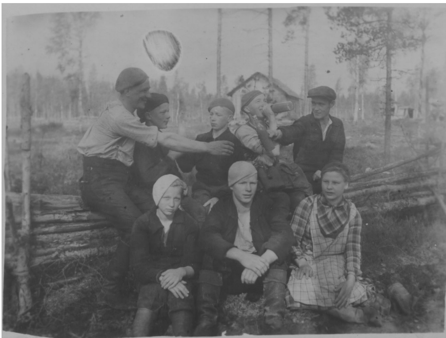
Nuoria propsinparkkaajia Sonkajärvellä vuonna 1936.