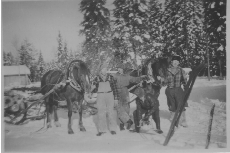
Talvisavottalaisia vuonna 1956 tai 1957. Huomaa moottorisaha toisena oikealta olevan nuoren miehen esittelemänä.

Ajomiehen taitavuutta kuvasi se, miten hän osasi käsitellä hevostaan. Hevosestaan hyvää huolta pitävää ja hevosen käsittelyssä osaavaa ajomiestä kutsuttiin hevosmieheksi. Hevosmies on ajomiehen ihannetyyppi. Taitava ajon suunnittelija ja toteuttaja oli hyvä ajomies, mutta hevosmiehen kategoriaan nousi vasta osoittamalla taitonsa toisten ajamana hankaliltakin vaikuttavien hevosten käsittelijänä. Olipa hevonen millainen tahansa, se sai ”suitsimiehen”, mutta hyvä hevosmies osasi myös valita hevosen, joka oli niin hyvä ja voimakas, ettei kuormaa tarvinnut työntää (Erkki, 1918; Veijo, 1920).