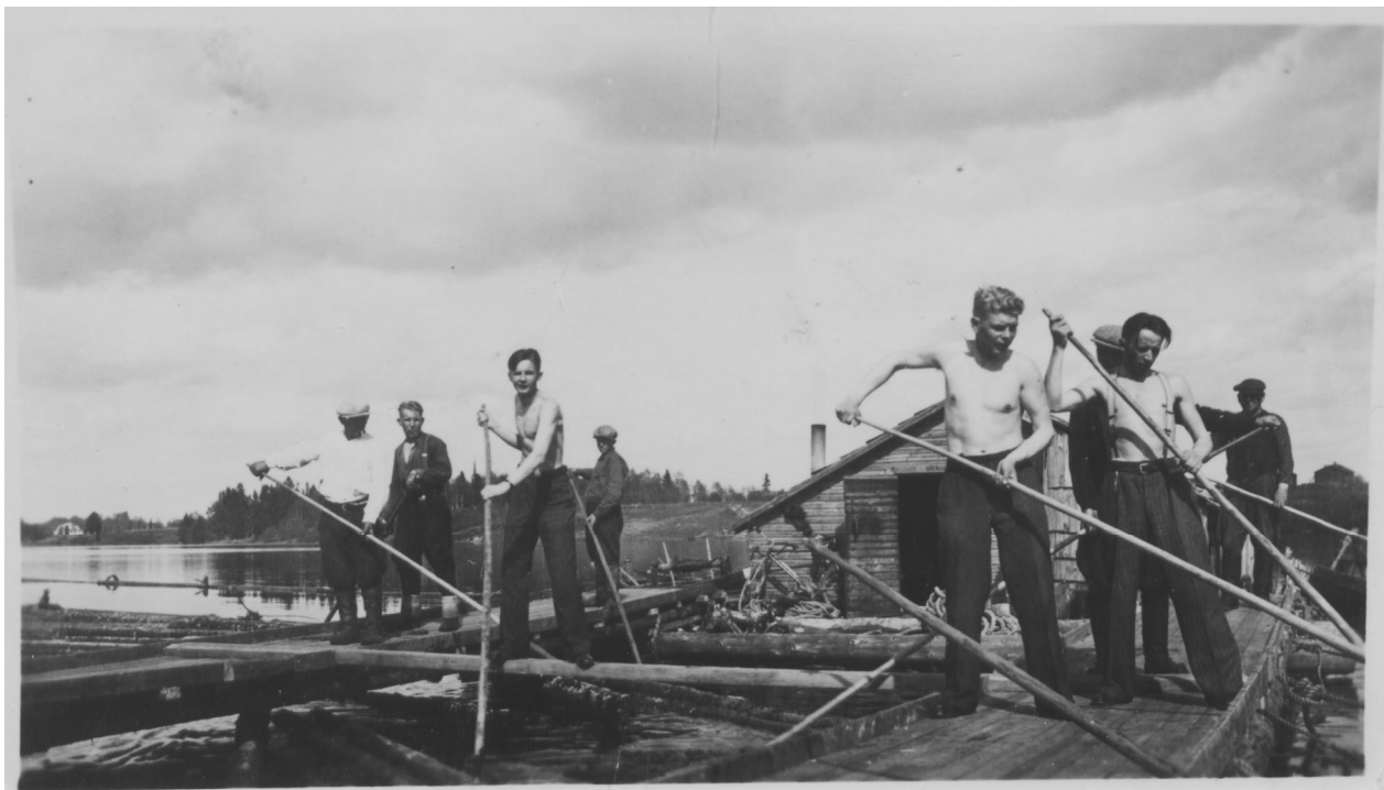
Nuorukaiset lajittelevat puita sortteerilla.