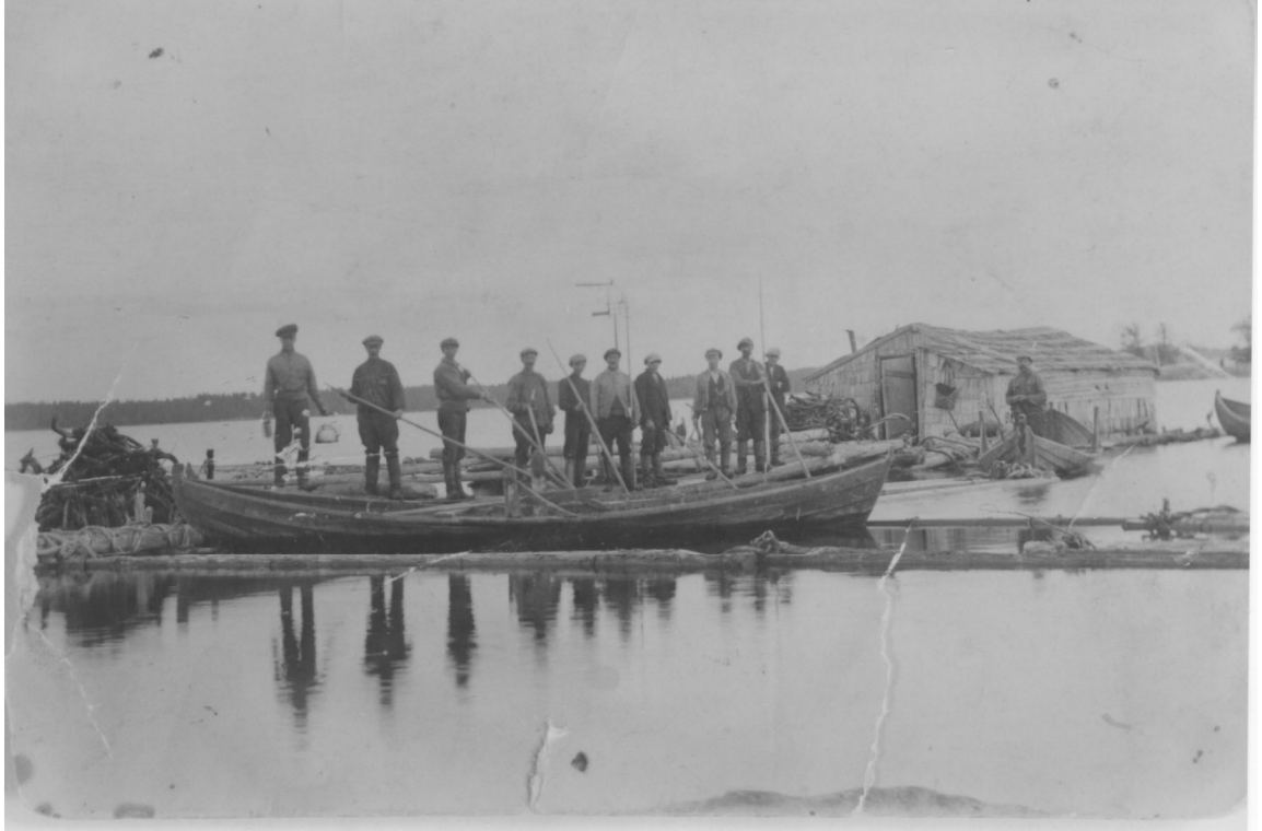
Tukkilaisia kekseineen keluveneessä..

Mittaa toisista otettiin myös muilla tavoin – kilpailtiin erilaisissa taitopeleissä ja urheiltiin. Taitoa mitattiin esimerkiksi yrittämällä saada lanka neulansilmään keppiä apuvälineenä käyttäen. (Taavetti, 1920.) Haastatteluista jää mielikuva, että yhdessä koettu aika oli tärkeämpää kuin ulkopuolisen maailman tapahtumien seuraaminen. Radiot tulivat kämpille toisen maailmansodan jälkeen (Taavetti, 1920).