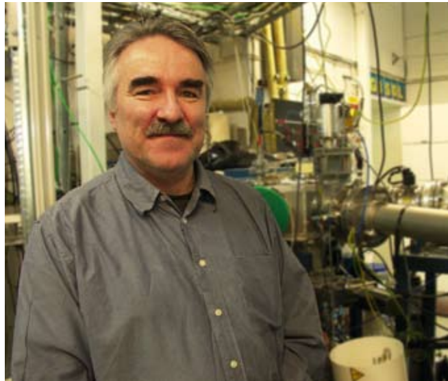
Einsteinin suhteellisuusteoriaa päästiin testaamaan vasta, kun hiukkaskiihdytin keksittiin 1930-luvulla. Yliopistollakin Einsteinin teoriat todentuvat kiihdyttimen putkissa.

Maalampi ei ole Einsteinin tapaan erakkotutkija, vaan viihtyy vuoropuhelussa muiden tutkijoiden kanssa.