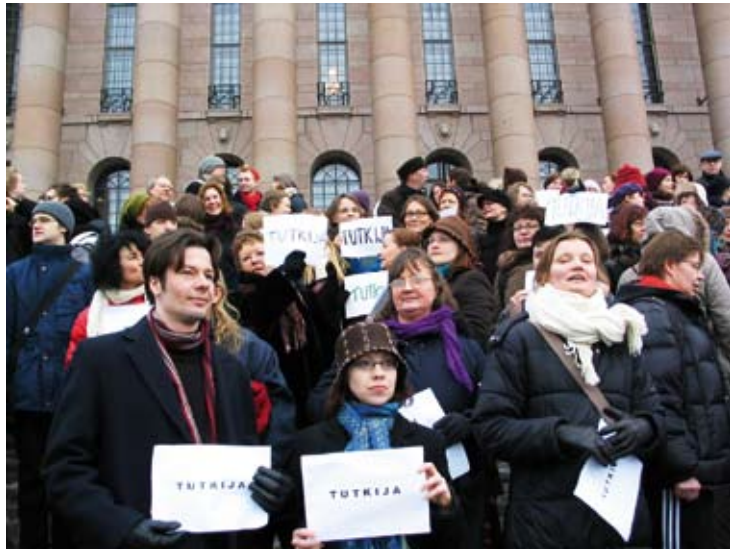
Tutkijat vauhdittivat sosiaaliturvansa parantamista mielenilmauksella eduskuntatalon edessä.

Tutkimustulosten hyödyntäminen yliopistoissa -raportti julkaistiin helmikuun puolivälissä. Julkaisu kokonaisuudessaan löytyy opetusministeriön Internet-sivuilta osoitteesta www.minedu.fi kohdasta julkaisut.