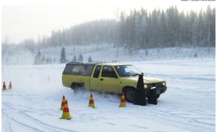
Henkilökunnan talviajotaitoja kohennettiin tammikuun lopulla.

Syksyllä yritetään vaikuttaa opiskelijoiden liikennekäyttäytymiseen.