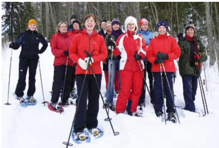
Lumikenkäälijät eivät pääseet helpolla Ylistönrinteen nousuissa.