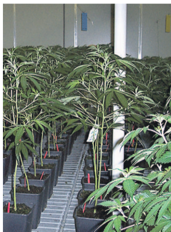
Bedrocan kasvattaa kannabiksen vesiviljelyjärjestelmässä.

kasveista. Sitten isot kukinnot pilkotaan pieniksi nupuiksi ja niistä poistetaan lehdet sekä jäljellä olevat varret.