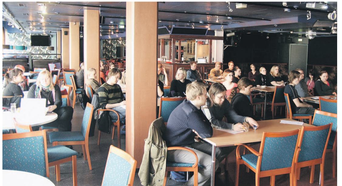
The General Union Meeting did not attract a full house a few weeks ago. Only about 30 people came up to Rentukka in Kortepohja.