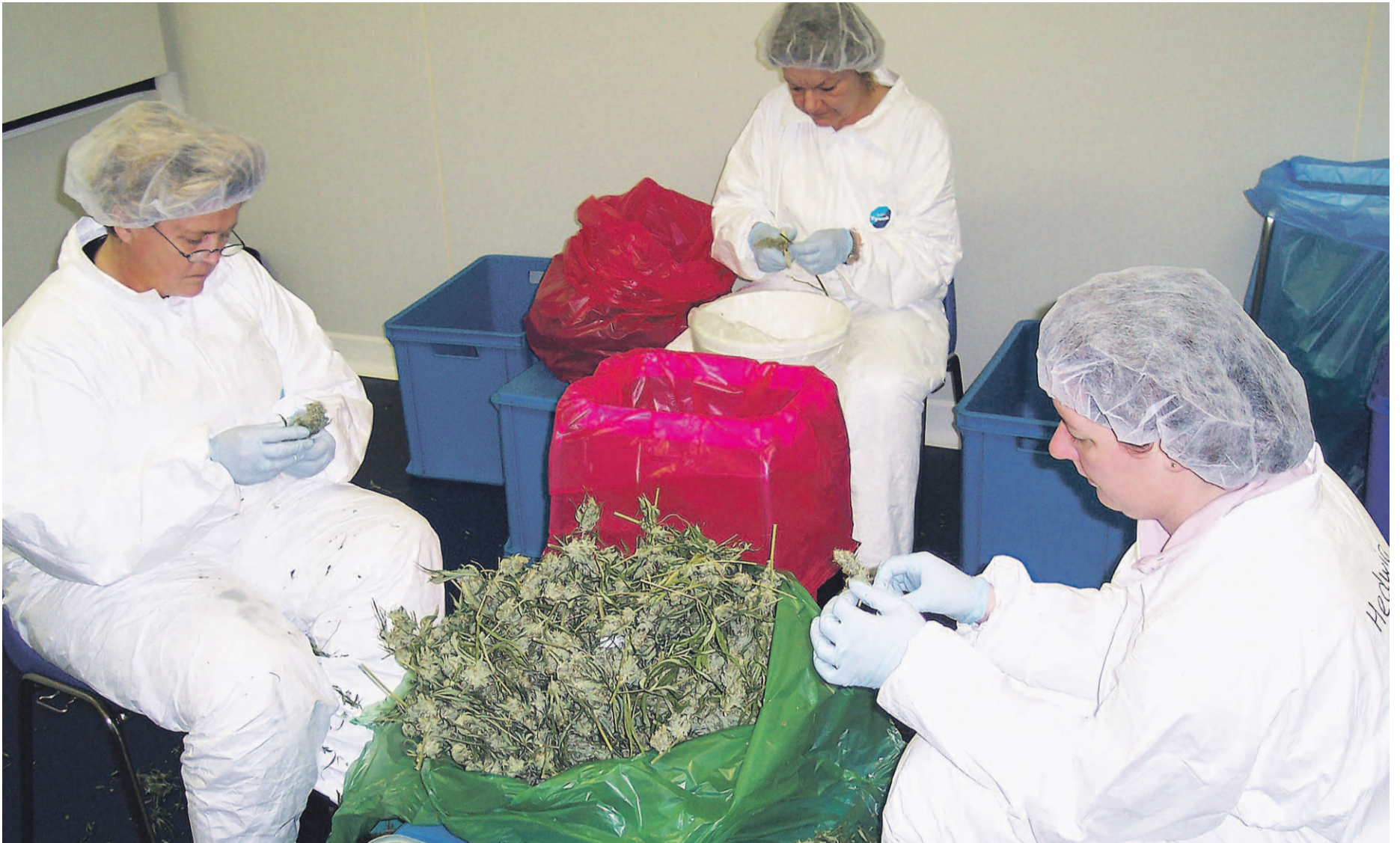
Bedrocanin työntekijät käsittelevät kuivattua satoa. Tämä on aikaa vievä työvaihe, koska kaikki kukinnot pitää siistiä käsin.