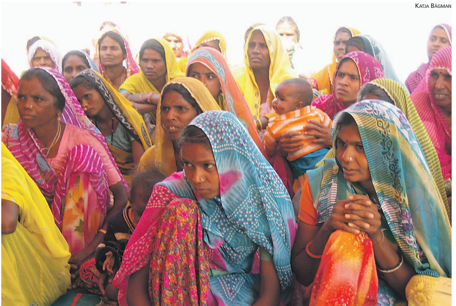
Bijolijassa Intiassa naiset kerääntyvät kokouksiin kuulemaan siitä, mihin mikrolainoja voi saada. Lainoja myönnetään vähävaraisille muun muassa kotien kunnostamiseen ja kotieläinten hankintaan.

Kolmevuotiseksi suunnitellussa hankkeessa on mukana 98 kylää. Tavoitteena on saada alempiin kasteihin kuuluvat, kastittomat ja erityisesti köyhät naiset ymmärtämään oikeuksiaan, mutta myös mitä he itse voivat tehdä oman ja lastensa terveyden, elintasonsa ja sosiaalisen asemansa kohentamiseksi.