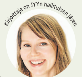
Kirjoittaja on JYYn hallituksen jäsen.

SEURAAVA VIIKKO kantaa oivallisesti nimeä JYYn 75-vuotisjuhlavuosiviikko, eikä juhlinta tällä kertaa rajoitu vain iltapukujuhliin, vaan ohjelmaa löytyy laidasta laitaan. Tule mukaan juhlimaan, ja kirjoita oma sivusi perinteiden tarinaan!