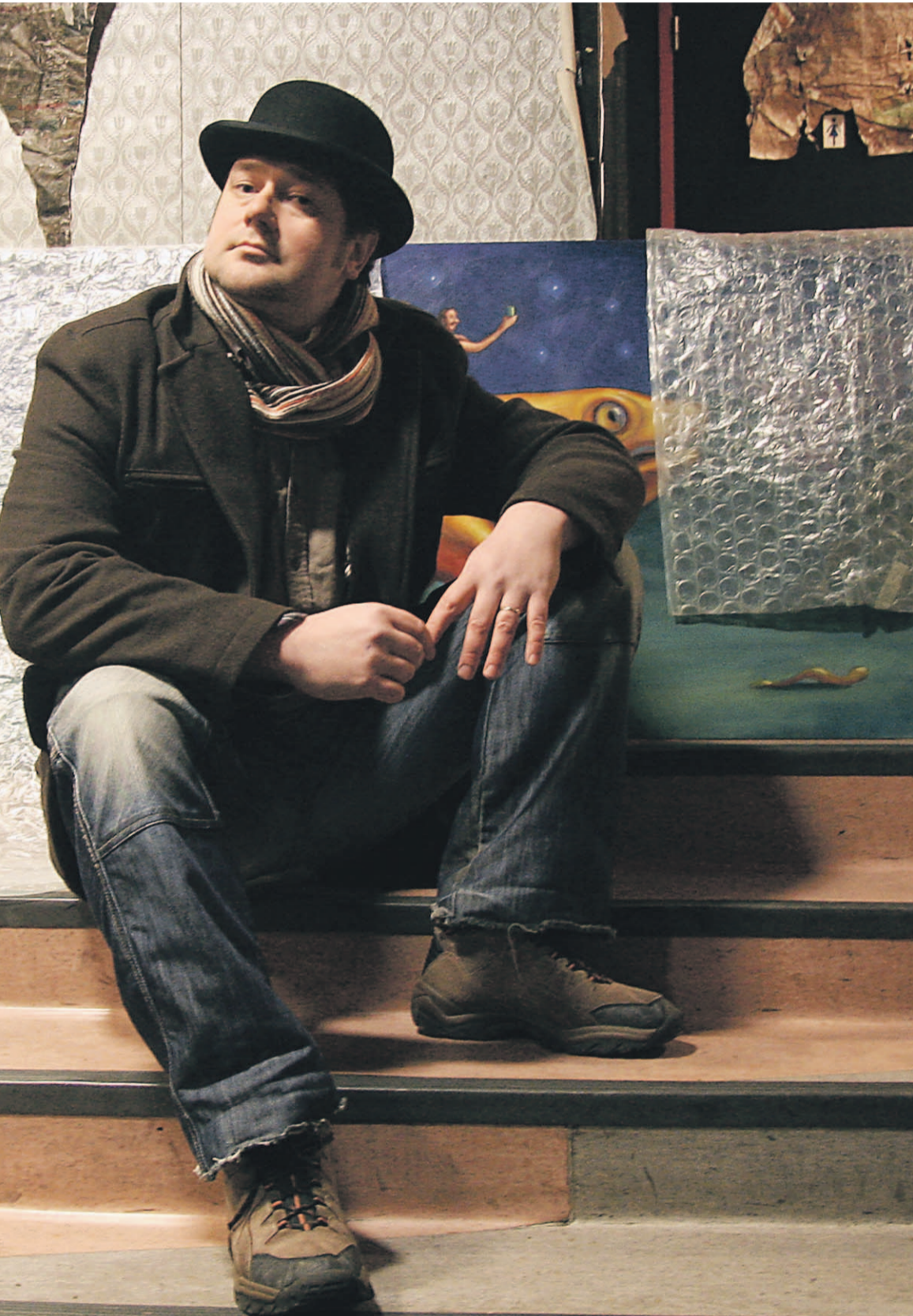
välle stand up-koomikolle. ”Halusin tehdä yliopistoelämään liittyvän maalauksen, mutta siitä tulikin

kus pelottavia”, hypnorealismiksi omaa tyyliisuuntaansa kutsuva taiteilija kertoo.